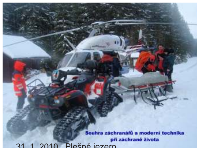
Souhra záchranářů a moderní technika při záchraně života