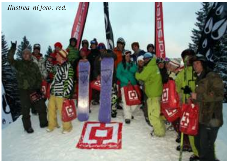
Ilustrea ní foto: red.

B žecké stopy na Šumav - celkové informace o údržb stop na Šumav naleznete na www.bilastopa.cz