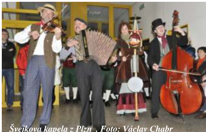
Švejkova kapela z Plzn .

na Domažlicku, dnes jsem p išla zavzpomínat a srovnávat."