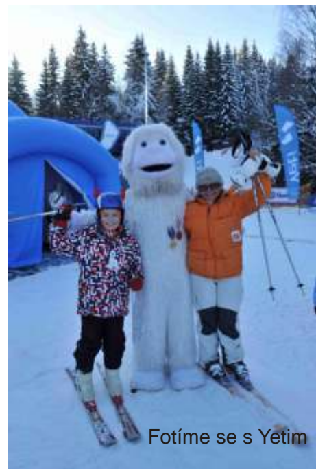
Fotíme se s Yeti