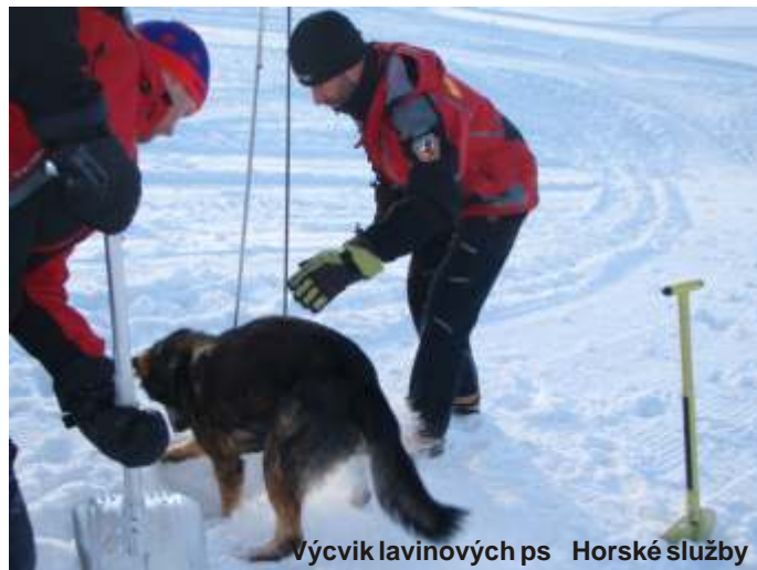
Výcvik lavinových psů Horské služby

Prachaticích, o souinnost v případě nálezů silně podchlazeného muže v prostoru „kamenného moře“ pod Plešným jezerem. Na místo události byli za použití techniky Horské služby