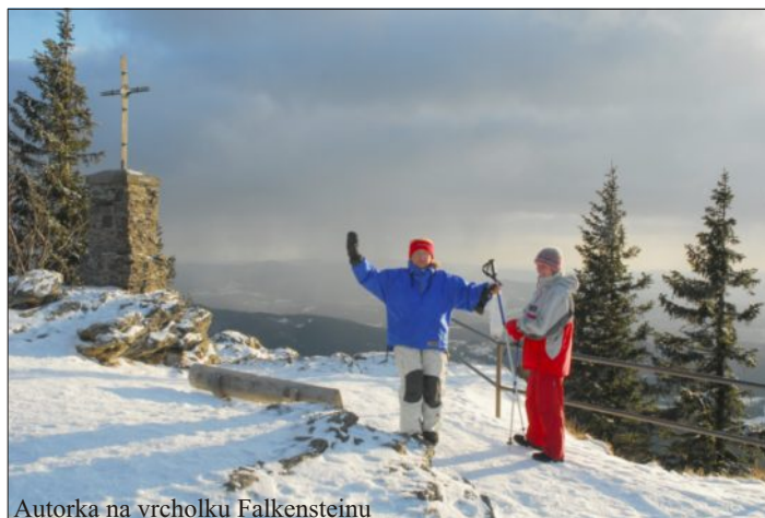
Autorka na vrcholku Falkensteinu