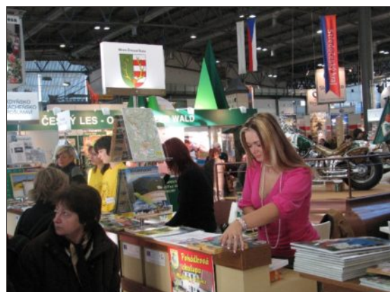
image prospektem Železnorudska, trhačkou cyklotras, mapkami běžeckých stop, prospekty lyžařských areálů a také prospekty jednotlivých ubytovacích zařízení, které nám byly dodány na infocentrum.

Z propagačních materiálů jsme se prezentovali Železnorudským katalogem,