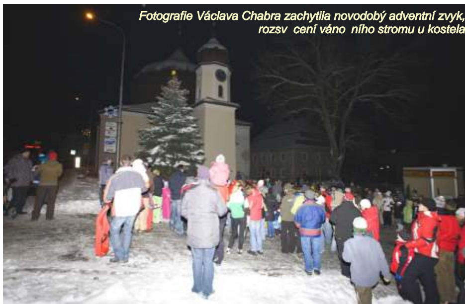
Fotografie Václava Chabry zachytila novodobý adventní zvyk, rozsvícení vánočního stromu u kostela

Na svátek sv. Štěpána (26. prosinec) chodili po vsi koledníci s bukalem. Šlo o soudek, který měl místo dna napjatou kůži. Na stědu kůže byl upevněn svazek žíní, který ten navlhčenými prsty vydával zvuk podobný prýhlasu ptáka bukalem. Koledníci