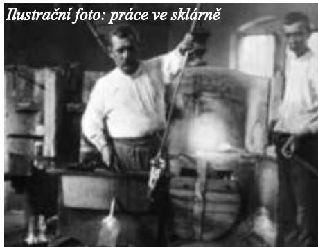
Ilustrační foto: práce ve sklárně

S rostoucí slávou českého skla se během 18. století množily nabídky českým sklářům pracovat v zahraničí. Již roku 1723 byl vydán první obecný patent zakazující emigraci sklářů. Byla zrušena povinnost vandru pro sklářské tovaryše a zazdržená sklářská, která měla být li odjetá zahraničí, byly vypsány vysoké odměny. Roku 1767 byl vydán Sklářský reglement, který platil do roku 1853 a upravoval pracovní podmínky sklářů v hutích, formy jejich platů, podmínky vyučování atd. Po této emigraci sklářů pokračovala a koncem 18. století nabyvala alarmujících rozměrů. V druhé polovině 18. století zápasilo české sklářství také s rostoucími cenami surovin. Především ceny dřeva za šplhat nahoru a stoupaly i ceny potaše. Společenské a politické změny v celé Evropě (Velká francouzská revoluce, napoleonské války, kontinentální blokáda a státní bankrot roku 1811) přinesly dlouhé období krize českého sklářství. Sklárny zastavovaly provoz. Hluboký propad nastal především po smrti se silnou konkurencí anglického dutého olovnatého skla a po zavedení vyšších celů v některých německých státech.