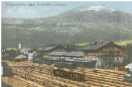
Hraniční nádraží Albstadt-Tübingen - Bavorská Ruda prochází velkou rekonstrukcí.

Nádraží v Albstadt-Tübingen – Bavorské Rud je symbolem srstání Evropy. Bylo otevřeno v