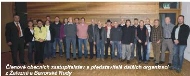
Členové obecních zastupitelstev a představitelé dalších organizací z Železné a Bavorské Rudy

Šlo o neformální setkání v nov zrekonstruované ArberLand Halle, otev ené 13. 8. 2010. Naši zastupitelé m li možnost projít si celou halu. Ta slouží jako prostor pro setkávání, kongresy a semináře. Druhá reprezentativní místnost má scénu, kde je možné promítat filmy nebo uspo ádat koncerty. Je tu p kn vybavená kuchyn ,