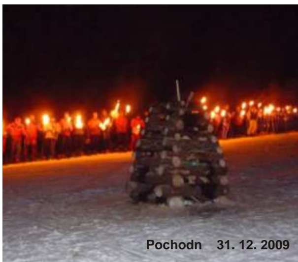
Pochodn 31. 12. 2009