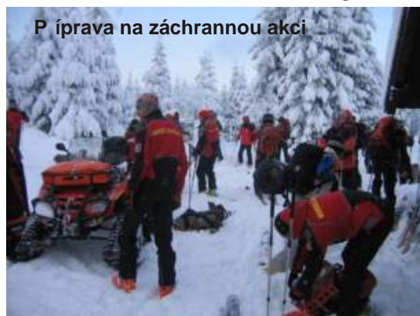
P íprava na záchranou akci

Doškolení se zú astnilo 35 záchraná z celé Šumavy. Tito dobrovolní záchraná i zajiš ují v pravidelných službách p edevším o sobotách