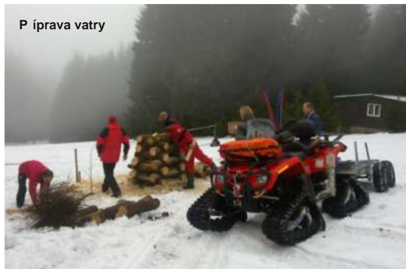
P íprava vatry