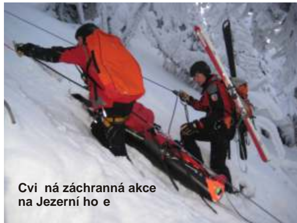
Cvi ná záchraná akce na Jezerní ho e