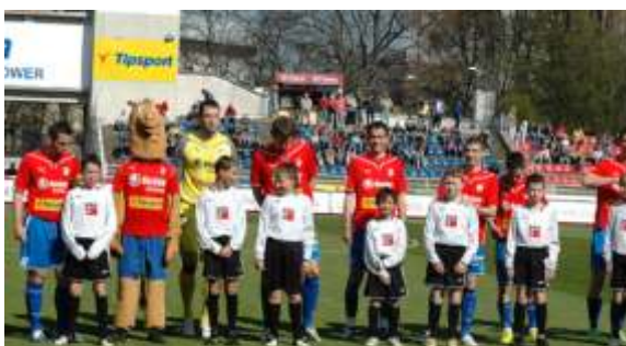
Nástup s fotbalisty Viktoria Plzeň