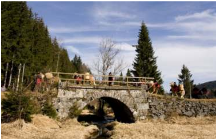
Text a foto: Václav Chabr

Atak i dnes se Zlatá stezka t ší velké pozornosti, i když se po ní již dávno nejezdí.