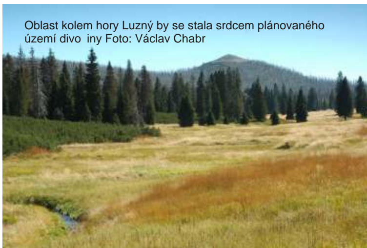
Oblast kolem hory Luzný by se stala srdcem plánovaného území divočiny.

znamená velkou plochu nezměněné přírody bez trvalého osídlení, která je chráněna před člověkem pro své přírodní hodnoty. Obce v kraji přitom už několik let usilují o překategorizování Národního parku Šumava směrem dolů, tedy do V. kategorie „chráněné území“ podle IUCN, ve které je například Krkonošský národní park. Tvrdí ochranná správa, že tedy ráda nastolila na Šumavě opačný trend. K prosazení této ochranné kategorie by bylo nutné změnit na obou stranách hranice zákony. To, že po vstupu do Schengenského prostoru v roce 2007 de facto padla omezení pro turisty putující směrem do nitra pohraničních hvozdu, správa NP Šumava vyřešila už v roce 2008 vytýčením nových zákazových území nazvaných „území zvláštní biotopové ochrany“ nebo „území s omezeným vstupem“.