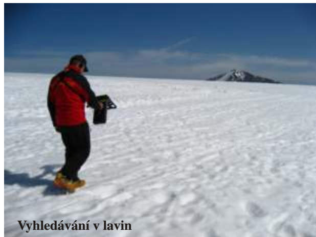
Vyhledávání v lavin

vážným úraz m p ivolán vrtulník Letecké záchrané služby. V pr b hu zimy pátrala Horská služba ve t ech p ípadech po ztracených turistech a na t chto akcích strávili záchraná i ty icet hodin. Technika Horské služby p i nich najela 518 km. Bohužel b hem zimní sezóny došlo i ke dv ma úmrtím. Dlouhá zimní sezóna vedla k nár stu po tu úraz na sjezdových tratích