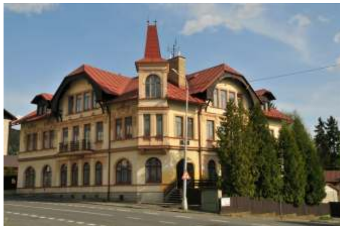
Fotografie zachycuje současnou podobu vily Seidel.

Dnes se vila jmenuje Alma a slouží jako rekreační středisko ministerstva vnitra.