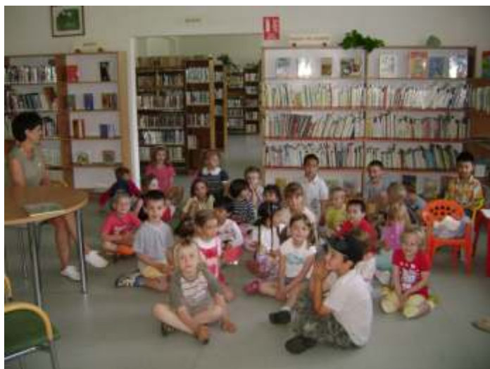
(Foto z návštěvy MŠ v knihovně)

Telefon 376 387 023, knihovnaruda@tiscali.cz www.knihovnaruda.cz/knihovnaruda/ internet zdarma kopírování A4: 2 K , barevné A4: 20 K laminování A5: 10 K , A4: 20 K