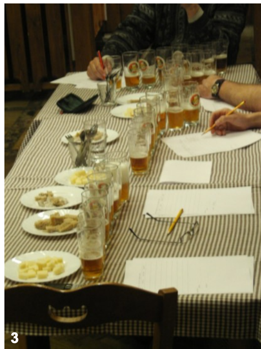
č. 1 - svěcení pivovaru v r. 2007; č. 2 - přípitek na zdar pivovaru - starosta Michal Šnebergr uprostřed); č. 3 - porota to neměla jednoduché; č. 4 - zleva - Mikuláš - FSSS, Frant. Strnad ml., Čert, v pozadí původní pivovar, v současnosti již přestěhovaný do Prahy.)

(ilustrační fotografie z redakčního archivu připomínají první ročník Pohádkového piva -