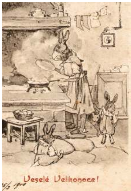
Ruční malovaná pohlednice z roku 1910 pro redakci všem ténám p řijemné Velikonoce.