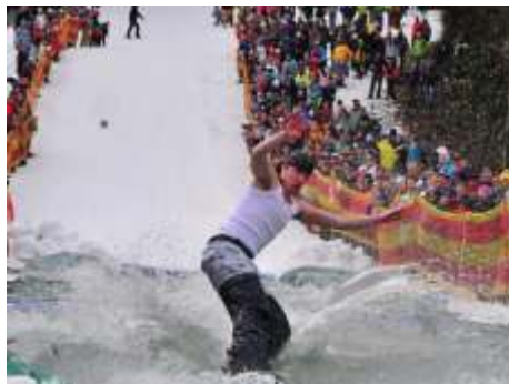
Tradice jízd přes louže na Špišáckém areálu vždy přiláká mnoho diváků, aby zhlédli odvážlivce, jako tohoto na snímku, který projel.

19. března se ve Ski areálu Špišák jelo přes louže. Je to velmi populární akce, kdy se majitelé různých klouzadel a plavidel rozjedou na dojezdu sjezdovky