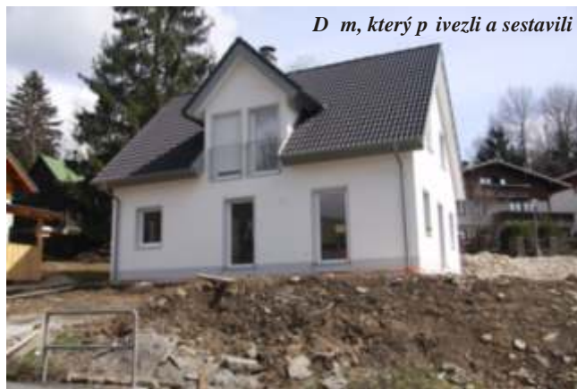
D m, který p ivedli a sestavili

Výhodu tohoto typu montovaného domku vidím p edevším v rychlosti a jednoduchosti výstavby na míst a relativní nezávislosti na ro ní dob a po así. V mém p ípad se jednalo o ty i betonové moduly opat ené dostate n silnou izolací, které se je ábem usadily na podkladovou desku i pasy a stavebnicovým systémem b hem jediného dne doplnily o další sou ásti stavby až po st echu. Funguje to díky p esnému zpracování za sucha v továrn , kde se vše b hem zhruba jednoho m síce p ed plánovaným datem stavby p ípraví, vysuší v peci a opat í všemi rozvody, obklady atp. Tedy ješt p ed dovozem na místo stavby je d m hotov prakticky skoro „na klí “. Nevýhodou m že pro n koho do jisté míry být volnost v prostorovém a tvarovém plánování stavby, protože na výb r máte n kolik desítek variant a tvar . Cena je po zamyšlení se nad nevyhnutelnými vedlejšími náklady p i klasickém zd ním stav ní tém srovnatelná, vyjde po