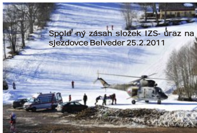
Společný zásah složek IZS - úraz na sjezdovce Belveder 25.2.2011