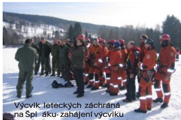
Výcvik leteckých záchranných na Špičáku - zahájení výcviku

vrtulník Letecké záchranné služby, který transportoval zraněné na specializované pracoviště Fakultních nemocnic. Závažné a komplikované úrazy lyžaře ošetřovali i záchranní Horské služby na Šumavě. 24. února došlo k velice závažnému úrazu ve sportovním areálu Kramolín, kdy si devítiletá lyžařka zpošobilá pádem na sjezdové trati závažné poranění břišní masivním krvácením. Následující den, 25. února, zasahovali