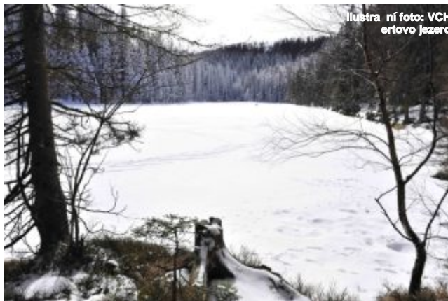
Ilustrace erto vo jezera