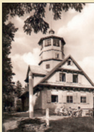
Mattušova chata na Pancíři, ještě bez vyhlídkové terasy

Možno zúčastniti se i pouze vycházky na Pancíř, k čemuž čas úplně stačí pro návrat ze Špičáku 19.08. Kdo chce mít oběd, zašle restauratérovi L. Dilgovi zálohu 10 Kč.