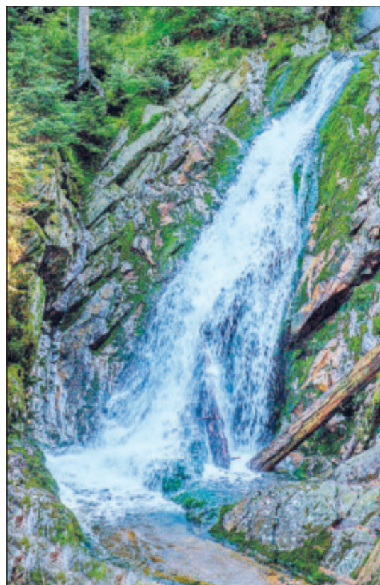
Bílá Strž – 13 m vysoký vodopád