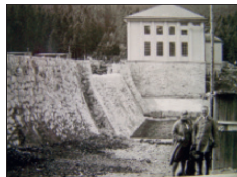
Přečerpávací elektrárna v Hamerském údolí, je dnes nepřístupná

Samotná elektrárna s vodní nádrží se nachází na levém břehu říčky Úhlavy v hamerském údolí, v nadmořské výšce 728 metrů. Pod elektrárnou byla zbudována umělá nádrž, z které se voda čerpala zpět do jezera. Ale vraťme se k jezeru. Odtud je voda vedena podzemním litinovým potrubím o světlosti 800 mm a průtokem 800 l/s do vyrovnávací komory, která je od jezera 1266 metrů vzdálena. Z železobetonové komory se voda tlačí do elektrárny ocelovým přírubovým potrubím o světlosti 560 – 600 mm a délce 1007 metrů. Celé potrubí, od jezera až po elektrárnu, je 1,5 metrů pod zemí, aby voda dobře odolala šumavským mrazům. V elektrárně voda předává svoji energii Peltonově turbíně s oběžným kolem o průměru 850 mm a 750 otáček za minutu, která pohání generátor na výrobu proudu o výkonu 1500 kW. Výstupní napětí 6000 V je transformováno na 22000 V a je vedeno do rozvodné sítě. Princip přečerpávací elektrárny spočívá v tom, že v době energetické špičky je voda z jezera využívána k výrobě elektrické energie, zatímco mimo špičku je voda čerpána zpět do jezera. Přečerpávací provoz, jenž se po ekonomické i provozní stránce velmi osvědčil, byl využíván až do roku 1960, kdy byl omezen. Elektrárna je chráněnou tech-