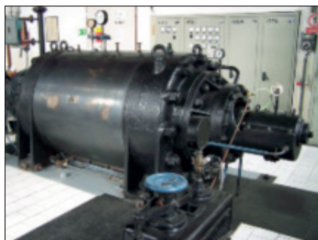
Strojní zařízení elektrárny a generátor jsou ještě v původním stavu