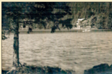
Černé jezero, kde dříve stávala restaurace a hosté se mohli povozit na lodičkách

Není tomu dávno, co v příjemném jinak Nýrsku u Klatov usnášeli se ještě vlivní a nesmiřitelní němečtí zástupci lidu z celé Šumavy o tom, že má být organizovaně bráněno přílivu českého živlu do Šumavy a že jest velké „nesmrtelné“ i „svaté“ myšlenky Německa na Pošumaví nejnebezpečnější čl. turistika, z Prahy vedená. Jest pochopitelné, že náš samostatný stát bude se i zde starati o sebe a vykáže myšlenku velkoněmeckou vždy za hranice – kam patří – a kde bude musiti ještě dlouho ochlazovati své připálené prsty. Vývoj věcí jde nyní však tím smě-