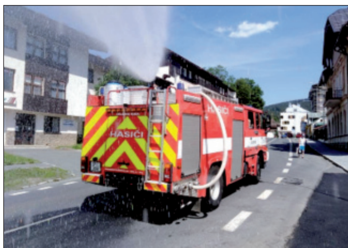
Ochlazování ulic města během horkých letních dnů