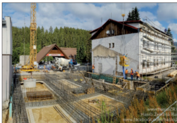
I přes mnoho komplikací v projektu se daří pokračovat ve výstavbě a rekonstrukci hasičské zbrojnice a stanice.