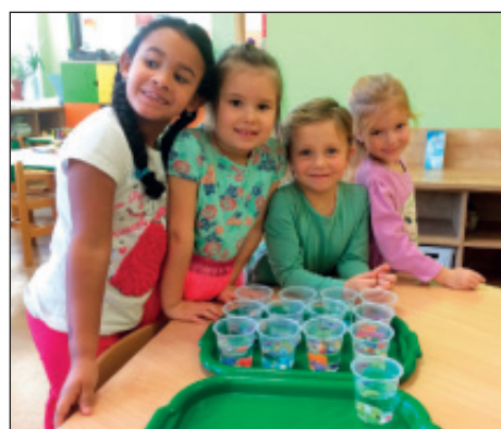
Experimenty s vodou