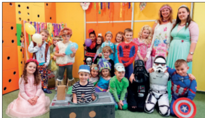
Maškarní rej u Broučků

Základní škola a Mateřská škola Karla Klostermanna Železná Ruda, příspěvková organizace