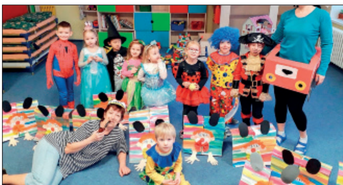
Maškarní rej u Sluníček

Za MŠ zapsala Monika Najmanová