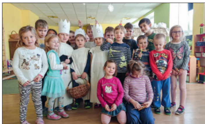
Tři králové ve školce

Za MŠ zapsala Monika Najmanová