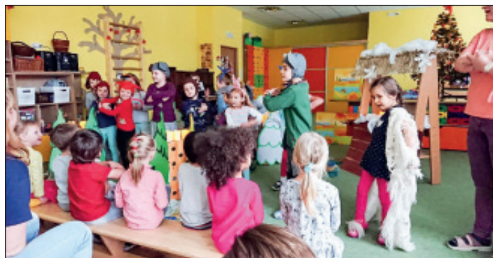
Broučci hrají pohádku

Adventní čas jsme ukončili hrou na Tři Krále. Školkou se nesl nápěv koledy: „My tři králové jdeme k vám, štěstí, zdraví vinšujeme vám.“