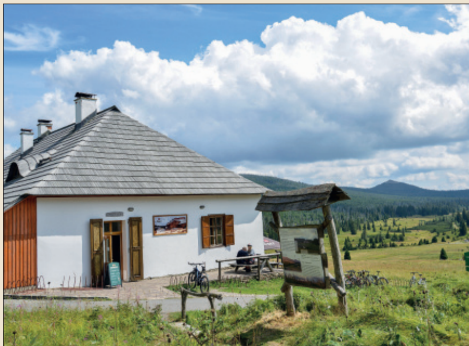
Březenská hájovna je i v dnešní době častým cílem turistů. Je odtud krásný pohled do Luzenského údolí, kterému vévodí Luzný s kamenným vrcholem.