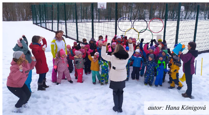
autor: Hana Königová

Rodičům předškoláků připomínám, že 11. dubna 2022 proběhne zápis nových školáků do první třídy (viz samostatná informace ve Zpravodaji a ve vývěskách města a školy).