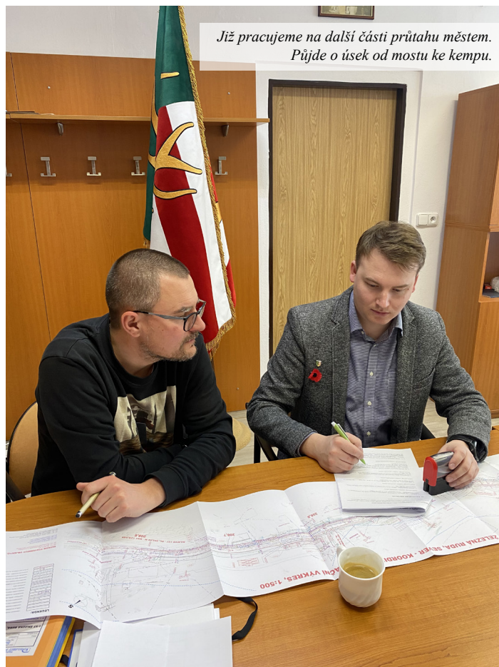
Již pracujeme na další části průtahu městem. Půjde o úsek od mostu ke kempu.

Všechny milovníky běžecího lyžování určitě těší, že na přípravě stop už naplno pracuje naše nová rolba. Podařilo se nám ji vysoutěžit za 4,8 milionu korun, což je oproti ceníkové ceně významná úspora. Na nákup jsme navíc získali dotaci ve výši téměř 2 milionů korun od Plzeňského kraje a za bezmála 800 tisíc