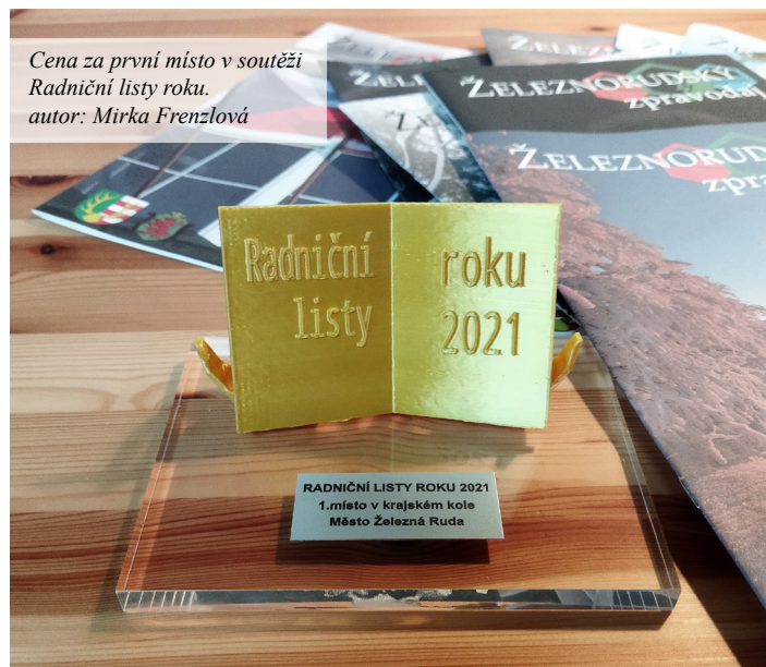
Cena za první místo v soutěži Radniční listy roku.

podobu Železnorudského zpravodaje. Ačkoliv je pro nás důležitý názor a zpětná vazba především od našich čtenářů, chtěli jsme, aby naši práci posoudili také odborníci, od kterých jsme očekávali kritický pohled na zpravodaj od zpracování článků po grafiku. Náš zpravodaj jsme proto přihlásili do soutěže, kterou vyhlašuje každý rok spolek Kvalikom. Z maximálních hodnotících 50 bodů jsme získali 46. Celkem se do kategorie periodik obcí do 2000 obyvatel přihlásilo 71 radničních periodik. V krajském kole jsme zvítězili a celorepublikově jsme pak skončili na parádním 6. místě. Výsledek soutěže nás moc potěšil a děkujeme všem, kteří nám fandí a každý měsíc se těší na nový zpravodaj. Pro nás je tento výsledek potěšující a zároveň motivující k další a lepší práci.