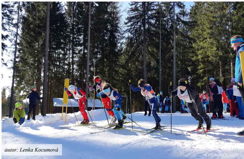
autor: Lenka Kocumová