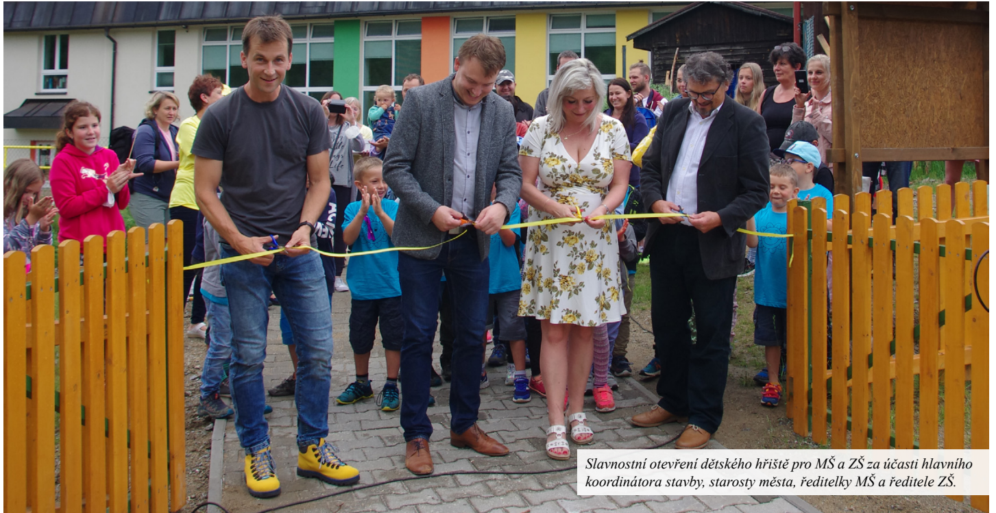
Slavnostní otevření dětského hřiště pro MŠ a ZŠ za účasti hlavního koordinátora stavby, starosty města, ředitelky MŠ a ředitele ZŠ.

v srpnu, tedy 6. - 7. 8. 2021 na centrálním parkovišti u Café Charlotte. Bohatý program vás po oba dva dny určitě zaujme a vybere si každý. Plakát na slavnosti najdete o několik stránek dál. Pokud chcete být aktuálně informováni o dění v Železně Rudě, sledujte oficiální facebookové stránky města