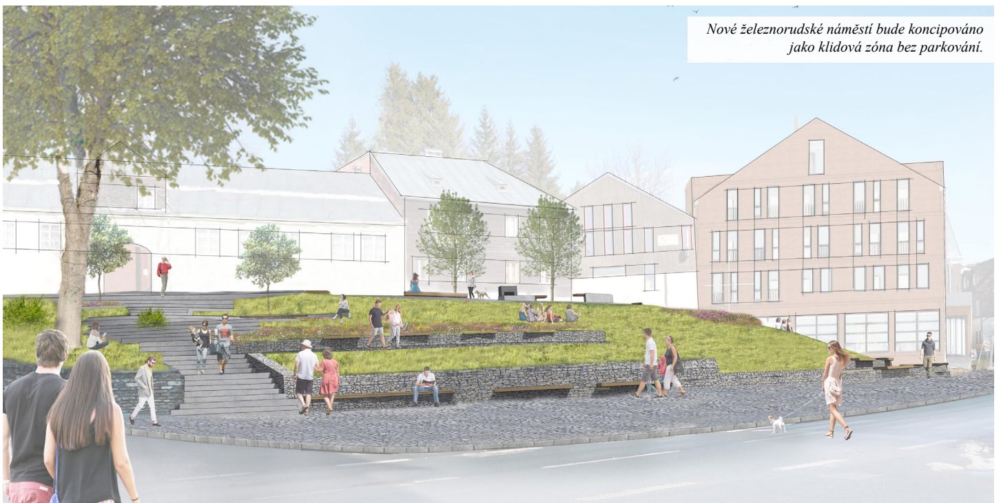
Nové železnorudské náměstí bude koncipováno jako klidová zóna bez parkování.