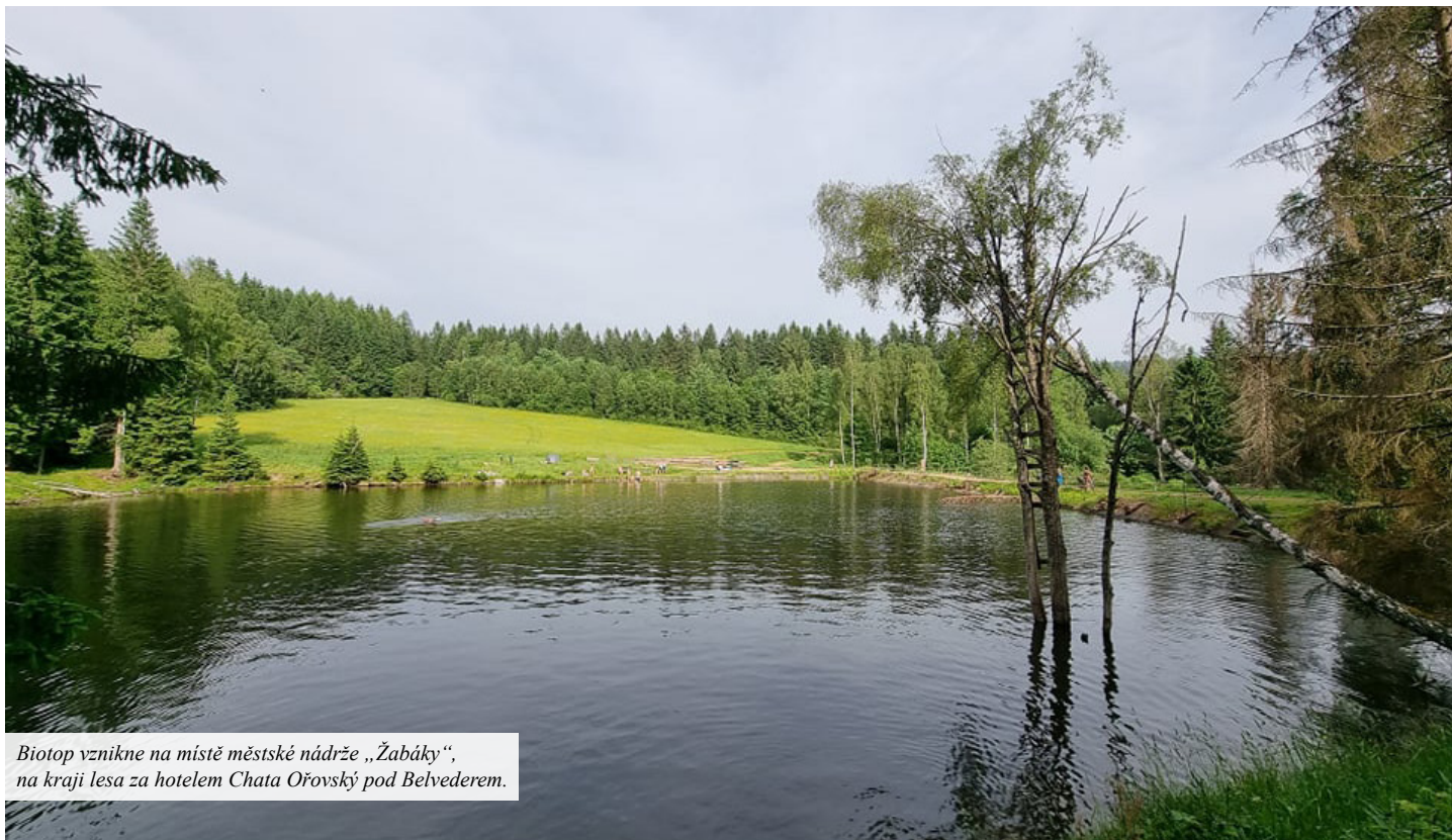
Biotop vznikne na místě městské nádrže „Žabáky“, na kraji lesa za hotelem Chata Ořovský pod Belvederem.

V polovině července začne rovněž výstavba přírodního biotopu Žabáky. Smlouvy jsou podepsané, hotovo musí být do října. Původně jsme chtěli celý projekt stihnout dříve, abychom se mohli vykoupat už během letošního léta, ale museli jsme začátek realizace posunout kvůli bobrovi evropskému, který musí vyvést mladé. Na celý projekt jsme získali dotaci téměř šest milionů, ale skvělou zprávou je, že se nám realizaci podařilo vysoutěžít za podstatně méně peněz. Měli bychom se kompletně vejít do čtyř milionů korun, přičemž finanční spoluúčast města bude do půl milionu.