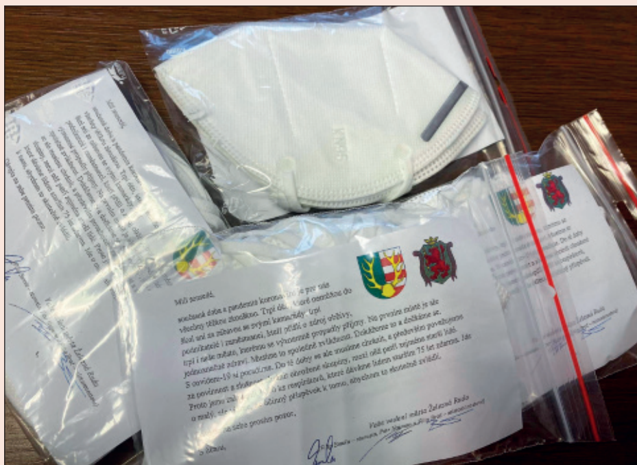
Zakoupili jsme tisíc kusů respirátorů pro občany starší 75 let.

už máme únor a skiareály, hotely, restaurace i další služby a řada obchodů jsou stále zavřené. Byli jsme zvyklí, že je v tuhle roční dobu zimní sezona v plném proudu. Hotely i penziony byly plné, na svazích lanovky a vleky vozily stovky lyžařů, dařilo se restauracím i dalším službám. Naše Železnorudsko se na řadu týdnů proměnilo v pulsující město s tisíci až desetitisíci návštěvníky. Nyní zde máme, zejména o víkendech, tisíce lidí také, bohužel nám to ale nepřináší obživu, ale pouze problémy. Odpadky i výkaly, auta parkující na všech možných i nemožných místech, chaos na sjezdovkách, kde se potkávají běžkaři, skialpinisté, pěši i bobující děti, ojedinelé i lyžaři a snowboardisté a samozřejmě i zvýšené riziko nákazy koronavirem. Samozřejmě chápeme, že lidé chtějí na čerstvý vzduch, užít si s dětmi sněhu. Je ale škoda, že se při tom někteří neumějí chovat, nebo se chovají bezohledně, jako by jim Šumava patřila. Proto buďme trpěliví, zachovávejme si dobrou náladu a nenechme se naštvávat malichernostmi.