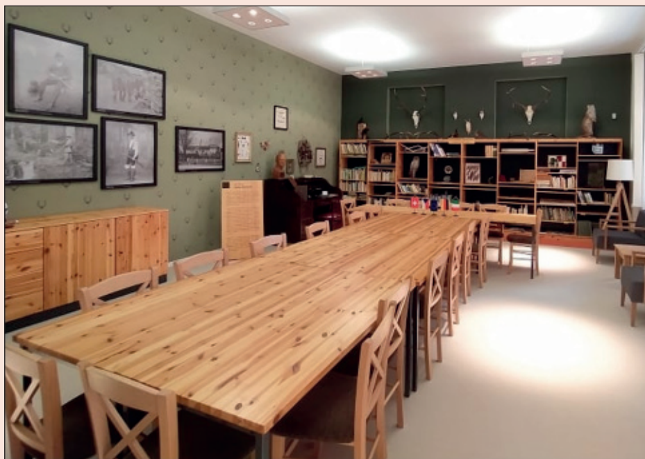
Komárkova knihovna nebyla nikdy tak plně vybavena.

Chceme, aby se nám společně na Železnorudsku žilo stále lépe a lépe. Základem spokojeného života je bezpečí. Velký skok se v tomto směru povedl vloni, když v rámci výstavby průtahu přibýly konečně chodníky podél Klatovské ulice, a rovněž nové přechody pro chodce a osvětlení. Nyní se snažíme nastavit funkční systém úklidu tohoto chodníku, kdy nám jej silničáři při každém průjezdu pluhu zahrnou. To je daň za jeho blízkost u silnice, jinak jej ale nebylo možné vybudovat. Se zvyšováním bezpečnosti chceme ale pokračovat, proto chystáme pořízení zbrusu nového kamerového systému pro naši městskou poli-