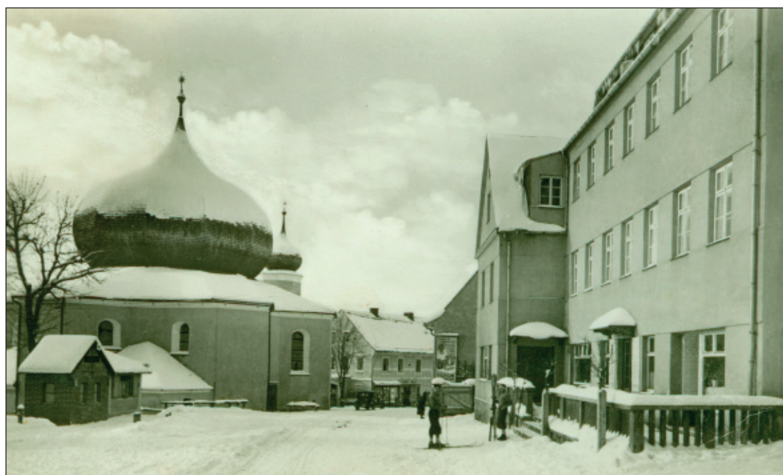
Centrum Železné Rudy, pokryté sněhem, někdy okolo r. 1935. V popředí hotel Slávie. Lyžování na Železnorudsku bylo populární již tehdy.