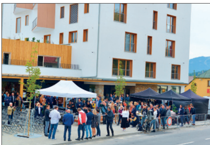
Nový veřejný prostor byl předán občanům i návštěvníkům města počátkem října.