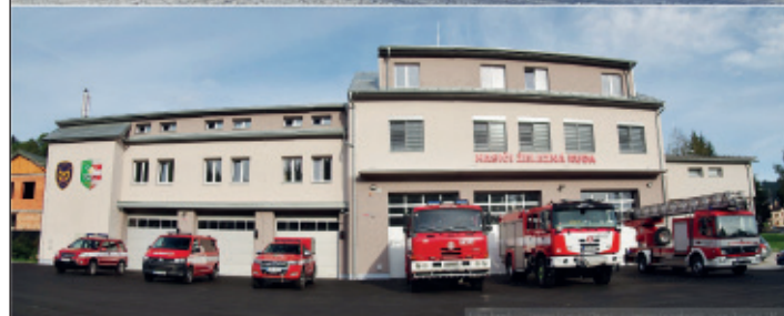
Nová hasičská stanice a zbrojnice byla předána železnorudským hasičům v září.