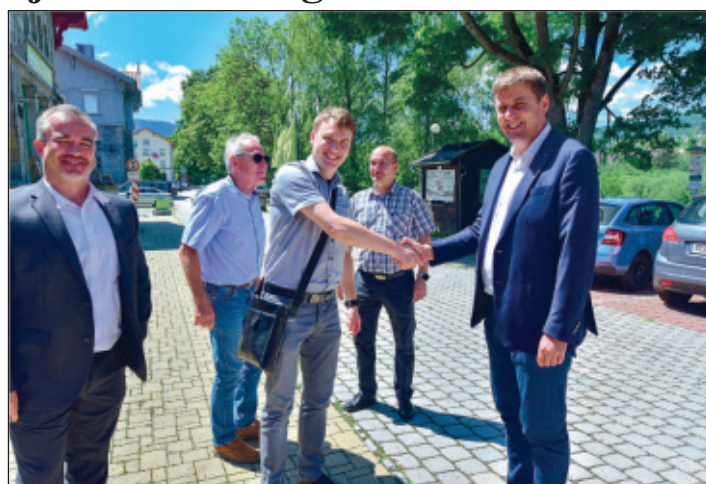
Na začátku prázdnin zavítal do Železné Rudy ministr zahraničí ČR, pan Tomáš Petříček.