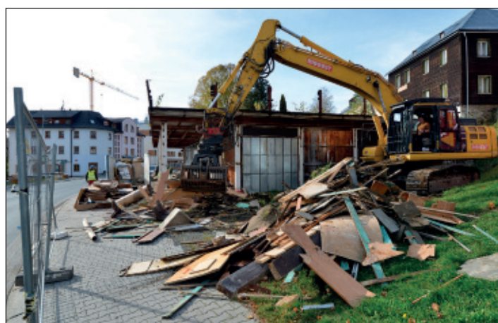
Ohavná ruina Espresso v centru města šla definitivně k zemi koncem října.