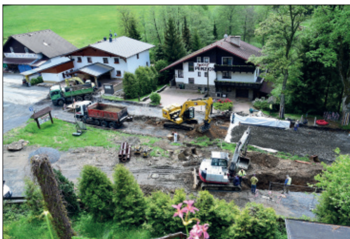
Stavba nového průtahu Železnou Rudou započala na jaře a dokončena byla s předstihem v říjnu.