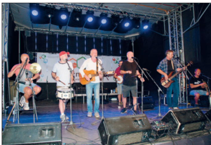
Děda Mládek Illegal Band na srpnových Železnorudských slavnostech.