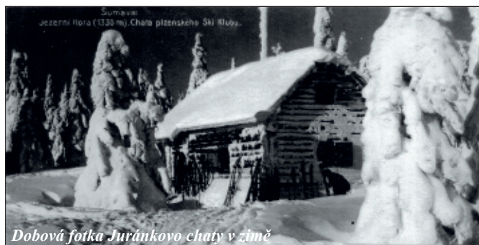
Dobová fotka Juránkovy chaty v zimě