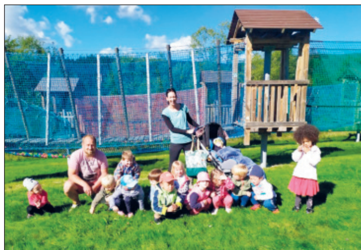
Čmeláci v Lanovém centru

Za MŠ zapsala Hana Königová, foto – archiv MŠ