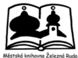
Městská knihovna Železná Ruda