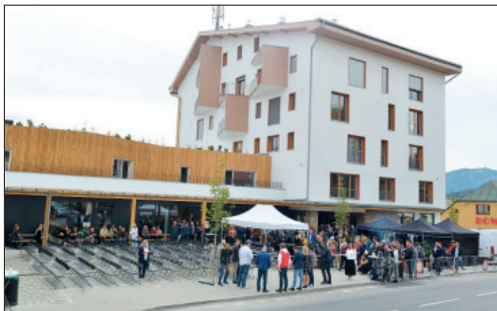
Stavba samotná je krásná a vkusná, doplňuje se s již dříve otevřenou Rezidencí Klostermann.