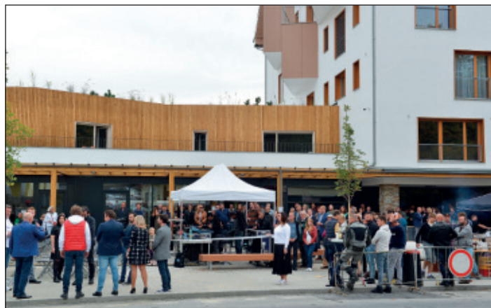
Slavnost byla pořádána výhradně ve venkovních prostorách.