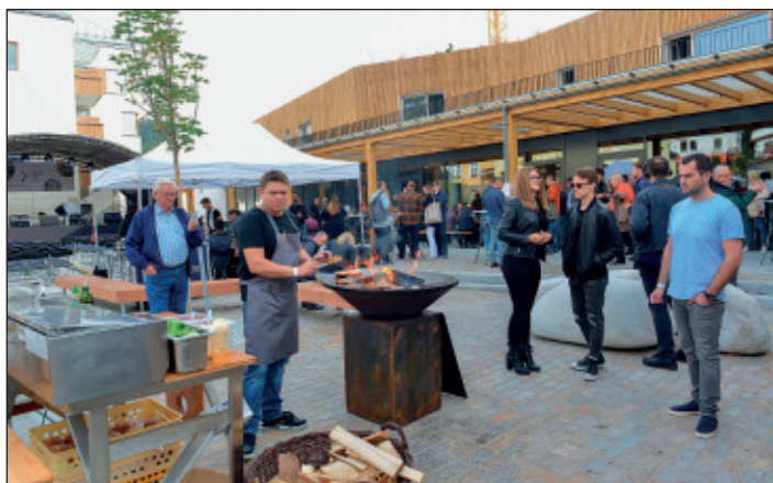
Skvělé občerstvení bylo samozřejmostí...