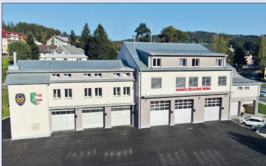
V Železné Rudě máme nejvýše položenou hasičskou stanici v České republice.

Ani koronaviru se nepovedlo zpomalit, natož zastavit stavební práce, a tak Hasiči v Železné Rudě mají zrekonstruovanou a dostavěnou hasičskou zbrojnici a hasičskou stanici. Na místě původní zbrojnice ze 70. let minulého století vznikl zcela nový objekt za 55 milionů se zázemím pro dobrovolné i profesionální hasiče. Železná Ruda na rekonstrukci získala dotaci EU ve výši 33 milionů korun z programu IROP, město přidalo přibližně 15 milionů a Ministerstvo vnitra a Plzeňský kraj dalších sedm