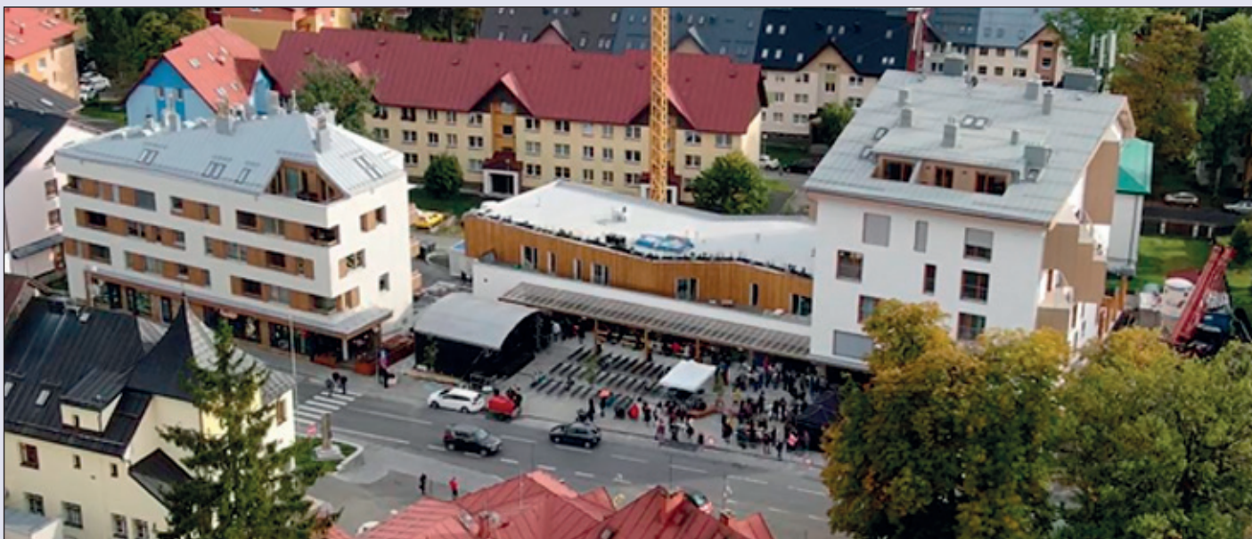
Foto nového veřejného prostoru

Tato hrůza hyzdí centrum Železně Rudy už několik desetiletí. Brzy však půjde konečně k zemi.