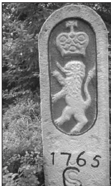
Hraniční kámen z dob Marie Terezie nese letopočet 1765