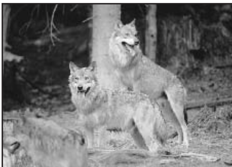
Tyto krásné vlky můžete zhlédnout v zooparku v Ludwigsthalu cca 10 km od Železné Rudy

Malé javorské jezero leží pod severní stranou Velkého Javoru. Pěšky je dobře dosažitelné z parkoviště Brennes, kam je vhodné vyjet ze Železné Rudy autem (v Bavorské Rudě za hraničním přechodem vpravo). Na parkovišti jsou v letních měsících umístěny parkovací automaty, denní poplatek je 2 €. K jezeru vás vede 2 km dlouhá značená turistická cesta. Je příjemná, stále se svažující z kopce a za prohlídku jistě stojí nádherná, volně přístupná bylinná zahrada u hotelu Mooshütte. Malé javorské jezero s plovoucími ostrovy patří k nejoblíbenějším turistickým cílům v Bavorském lese. Je pozůstat-