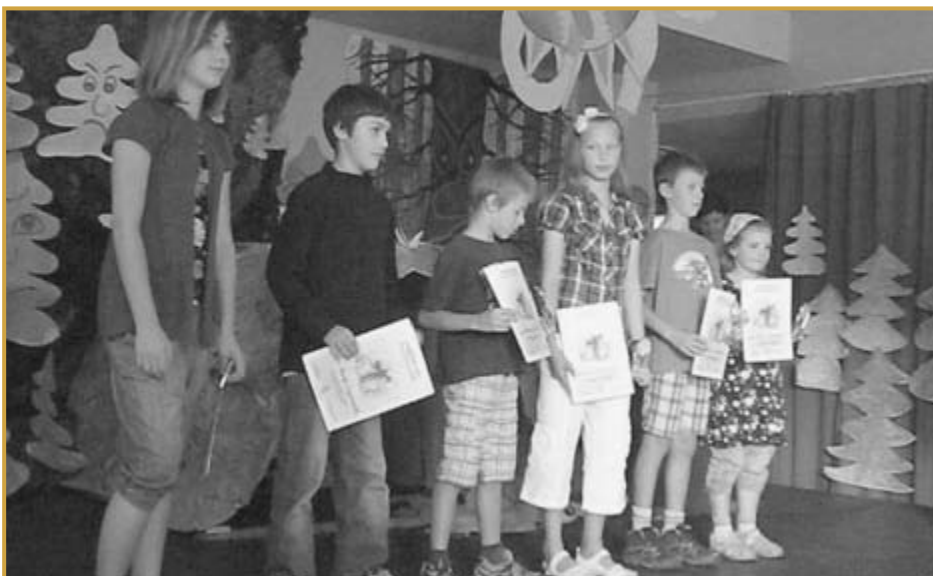
Mladí železnorudští lyžaři