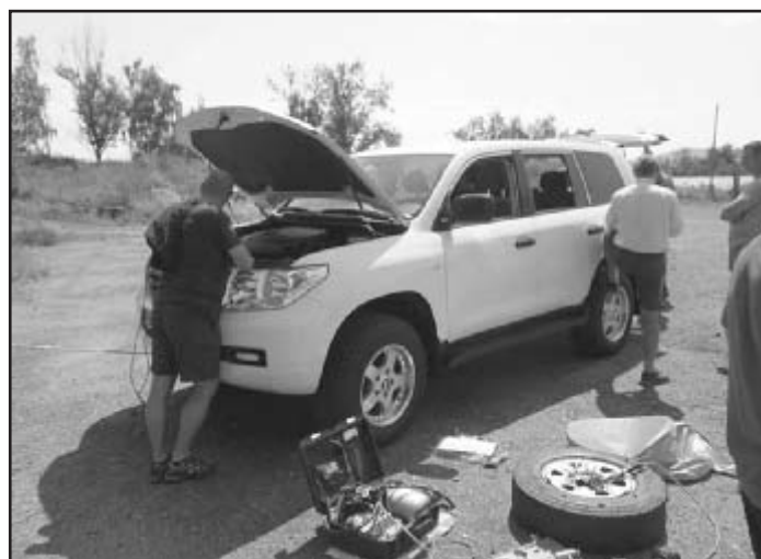
Doškolení profesionálů HS ČR – ukázka terénních vozidel