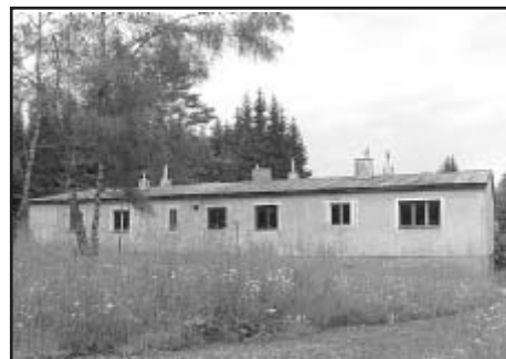
Bývalá rota na Svárožně čeká na nové využití

K tomuto památnému místu je dnes ztížený přístup kvůli ochraně přírody. Nejbližší je k ní z místa zvaného Rozvodí mezi Černým a Čertovým jezerem – toto místo je krásné dosažitelné sedačkovou lanovkou na vrchol Špičáku. Z Rozvodí nahoru k bývalé chatě je však vstup zakázán. Zvolme tedy jiný, zcela legální přístup: V Železné Rudě-Alžbětíně naproti hotelu U Larvů odbočíme po asfaltové cestě, označené červenou značkou. Po půl kilometru odbočuje červená značka vpravo nahoru, ale my jdeme stále rovně Přírodní památkou Královský Hvozd. Po čtyřech kilometrech dojdeme k bývalé vojenské rotě Svárožná, kterou po roce 1989 ochránáři nezlikvidovali, naopak, rota stojí dál a postupně se obnovuje. Stopy bývalé vojenské činnosti lze ještě vidět, je tu například stožár na vlajku nebo rozpadající se psí kotce. Tento úsek cesty není turisticky značený – jsou tu jen symboly skláře – jde o tzv. Sklářskou cestu. Vlevo je stanoviště s razítkem „Železnorudské vrcholy“ a lávka přes Svárožnou. Za bývalou vojenskou rotou odbočuje doprava spojka k Čertovu jezeru, ale my jdeme pořád rovně podél říčky Svárožná přibližně dva kilometry. Napravo se nám postupně otevře pohled na celkem šest kamenných moří, až dojdeme k hraničnímu kamenu č. 33. Odtud se vydáme úzkou pěšinou přímo po hranici. U hraničního kamene