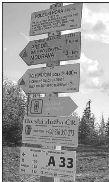
Polední hora (Poledník) vrchol – informační tabulka horské služby a traumabod NP Šumava