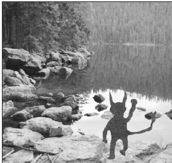
U Čertova jezera dodnes číhá čert

Se svolením redakce Týdeníku Televize zpracovala LCK