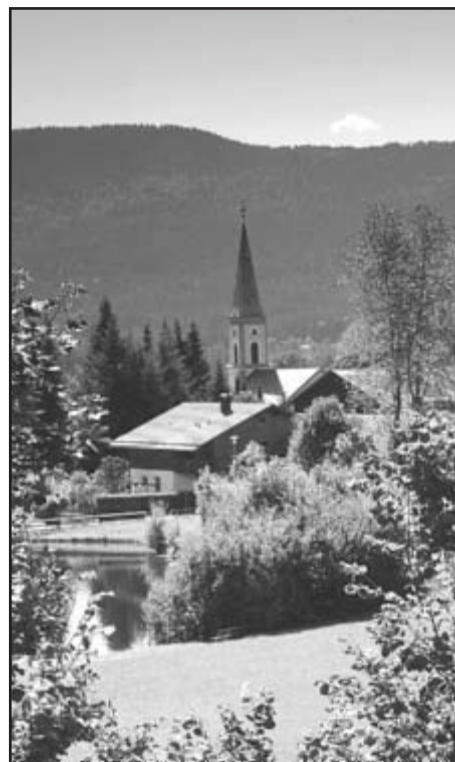
Nedaleké malebné městečko Lohberg, kde se nachází zoopark, přírodní koupaliště a kde mají svůj pivovar

E-mail: info@reisebuero-wenzl.de . Internet: www.kleine-arberseebahn.de .