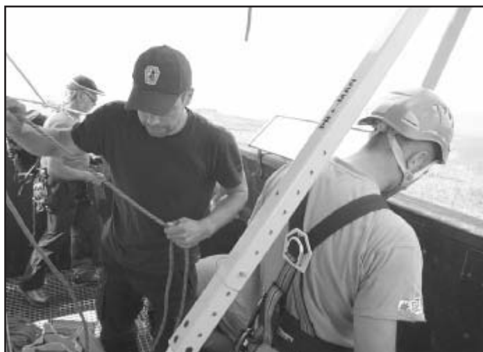
Doškolení profesionálů HS ČR – příprava záchranné akce

fektně imitovat opravdové chování zraněné osoby. Středa byla věnována záchraně osob z hloubky a výšky. Sněžné jámy na Křemelné a vyhlídková věž na Poledníku byla vybrána jako ideální výcvikové prostředí pro nácvik těchto činností. Čtvrtek byl věnován fyzické etapě, kdy pro účastníky tohoto doškolení byla vybrána etapa na horském kole v délce 50 a 80 km v zajímavých lokalitách centrální Šumavy a pro pěší pochod byl pro svoji exponovanost a zajímavost vybrán kaňon řeky Křemelné. Páteční zaměstnání bylo věnováno pravidelnému proškolení bezpečnosti práce a novinkám v silničním provozu pro profesionální řidiče. Během tohoto náročného týdne byl program doplněn o přednášky z oboru glaciologie - zkoumání ledovců, příčiny oteplování, výzkum sněhu a klimatické změny či představení nového horolezeckého vybavení a pomůcek k záchraně osob v horách od předních renomovaných výrobců. Celého týdenního vý-