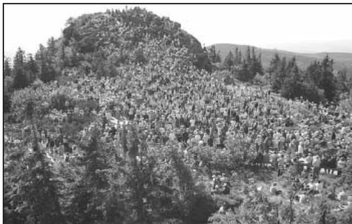
Každý rok v srpnu se sejdou stovky lidí na Velkém Javoru, kde se koná tradiční pouť a mše svatá, kterou celebruje farář z Bavorské Rudy