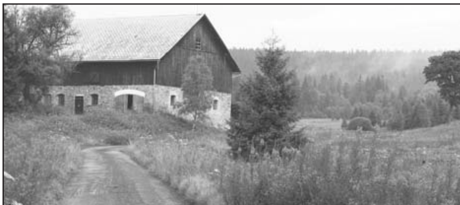
Nový Brunst v ranní mlze nadchne nejen cyklisty