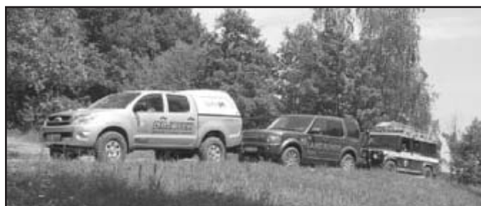
Doškolení profesionálů HS ČR – nácvik jízdy terénních vozidel