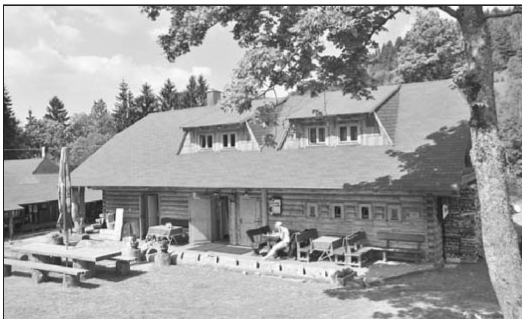
V restauraci Kandahár se dobře najíte pravé české kuchyně a slovenskými haluškami