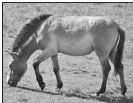
V zooparku Ludwigsthal můžete pozorovat i koně Przewalského