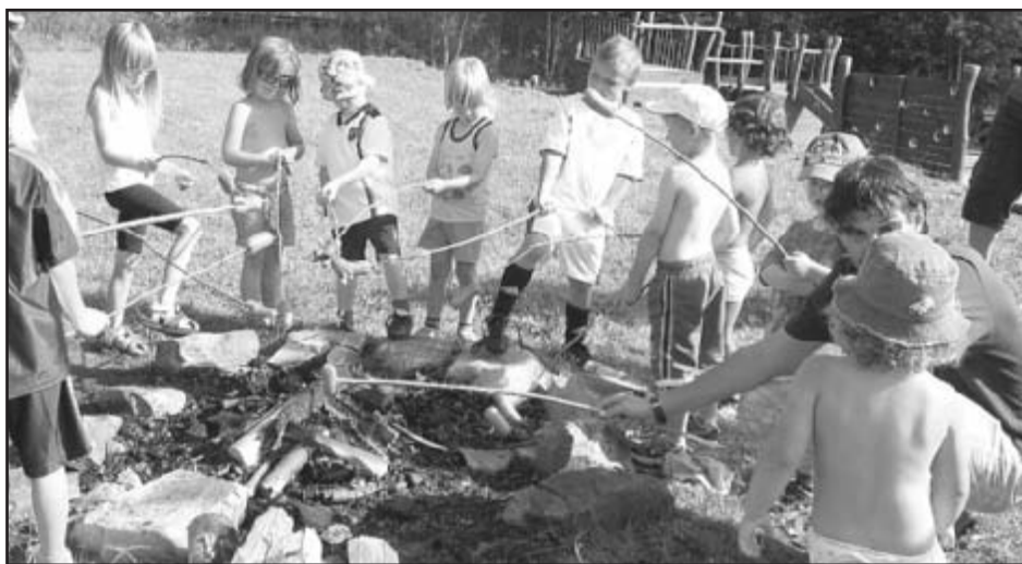
Poslední prázdninový trénink fotbalových minižáků 29. 6. se neobešel bez opékání špekáčků

Nejvíce otazníků skrývalo vystoupení A týmu mužů. Podaří se soutěž udržet? Budeme spokojeni s umístěním ve středu tabulky? Nebo budeme atakovat příčky nejvyšší? To byly nejčastější otázky, které mezi fotbalovou veřejností kolovaly. Nečekaně 4.místo a atakování nejvyšších příček tabulky daly jasnou odpověď. Zejména začátek jarní části připomínal slávu železnorudské kopané z let minulých. V prvních šesti utkáních na hřištích soupeřů získalo mužstvo 15 bodů za 5 vítězných utkání. Prohrálo pouze na hřišti největšího favorita z Dlouhé Vsi. V té době dokonce mužstvo pomyslelo na atakování nejvyšších příček tabulky a případný boj o postup. V prvním domácím utkání mužstvo prohrálo s dalším aspirantem postupu, týmem z Vrhavče, a naděje se rozplynuly. Přesto 4. místo je úspěchem nováčka a zároveň závazkem do budoucna. Mužstvo složené pouze z místních odchovanců, doplněné zkušenými fotbalisty Jirkou Malým z Nýrska a hostujícím Davidem Gajduškem z Klatov (jinak náš odchovanec), ukázalo, že se dá opět hrát atraktivní fotbal a tahat za nitky celého přeboru.