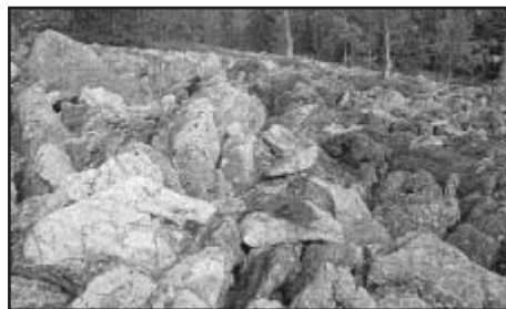
Kamenné moře pod Svarožnou

a Zadní Chalupy. To byla obec, která byla po válce srovnána se zemí. Dnes je na jejím místě překrásná louka s břízkami. Ze Zadních Chalup je možno jet na hraniční přechod Rittsteig, to jste už v Německu. Z Rittsteigu (zde dobré restaurace) se dobře dojde na hraniční přechod Svatá Kateřina a odtud do Nýrska. Tato cesta je vhodná spíš pro cyklisty. Pěší se mohou ze Zadních Chalup vydat rovnou za nosem do Skelné Hutě a Nýrska. V Nýrsku doporučuji po této túře v každém případě použít k návratu vlak.