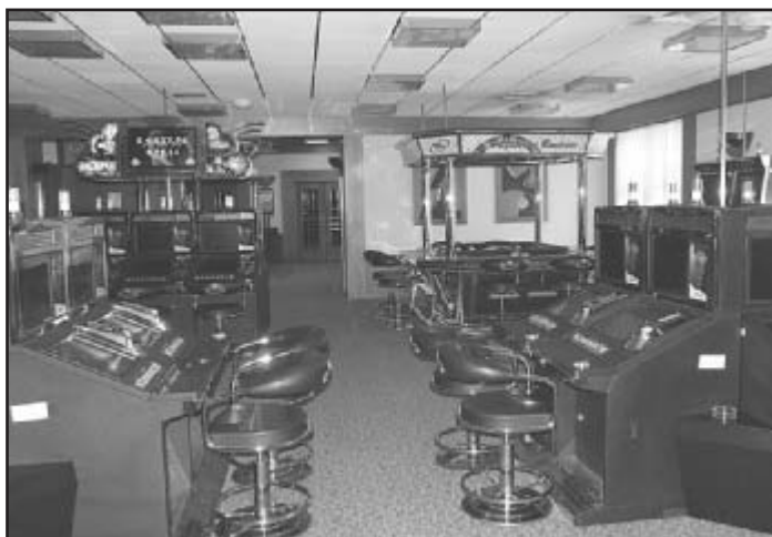
Pohled do herny

INGO Casino Royal Železná Ruda se řadí k čtyřem dalším pobočkám po celé České republice. Hlavní centrálu najdete ve Františkových Lázních, ostatní pak v Mariánských Lázních, Aši a ve Zlíně. Historii tohoto