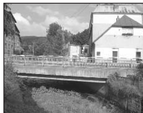
Dnešní pohled na kdysi stržené mosty

Při záchranných akcích a odstraňování škod po této povodni se ukázalo, že je ještě celá řada občanů, kterým osud města není lhostejný a kteří neumi jen kritizovat, ale jsou ochotni přiložit ruku k dílu i za velmi ztížených podmínek. Těm všem patří dík.