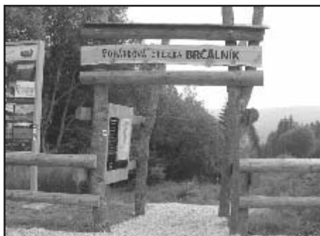
Račte vstoupit na Pohádkovou stezku

Letos 15. a 16. června byla slavnostně zno- vuotevřena Pohádková země Brčálník na Že- leznorudsku. Dostanete se k ní buď autem po trase Železná Ruda-Špičák- Hojsova Stráž – Brčálník nebo vlakem se stejnými zastávkami. Železniční stanice, na níž vystoupíte, se navíc nachází pouhých 50 metrů od Horského areálu Brčálník. Stačí se dát po tajuplné pě- šince vroubené smrků. Pokud jste na Šumavu přijeli s úmyslem pěstovat zejména pěší turis- tiku, rozhodně si nenechte ujít příjemnou pro- cházku, při které se dostanete právě do Pohádkové země a zahrady. Stačí projít Po- hádkovou branou přímo na parkovišti na Špi- čáckém sedle a nechat se vést ani ne tříkilometrovou Pohádkovou stezkou s dva- nácti tématickými zastaveními. Pohádková stezka je úzce spjata s knihou Vítězslavy Klim- tové Putování Pohádkovou zemí. Chlapci Hon- zíkovi se totiž ztratil skřítek a on se ho se sestříčkou Aničkou vydává hledat. Při svém putování se setkává s jinými skřítky, jimž jsou jednotlivá zastavení věnována. Půjdete-li s dětmi volným tempem, zdoáte tuto pouť zhruba za hodinu.