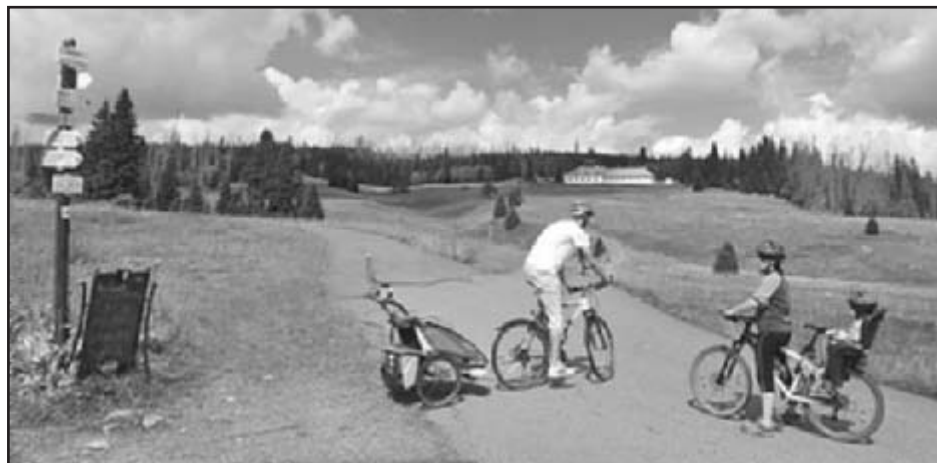
Hájenka pod Březníkem, kde se můžete občerstvit a zhlédnout výstavu o šumavském spisovateli Karlu Klostermannovi

vjíždíme do obce Modrava. Hned na první odbočce se dáваме doleva směrem Březník. Na Březník vede krásná asfaltka s velmi pozvolným stoupaním. Po příjezdu se můžeme občerstvit na Březnické hájovně a pokochat se pohledem na Luzný. Vracíme se zpátky stejnou cestou, ale cca po 2,5 km uhýbáme na křižovatce doprava směrem Černá hora. Dojedeme k Ptačí nádrži a dáme se opět doprava směrem Černá hora. Stoupáme zhruba 2,5 km. Při stoupaní se občas zastavte a rozhlédněte se za sebe do kraje. Úchvatné panorama. Z Černé hory sjedeme přímo k Pramenu Vltavy. Od pramene se vydáme rovněž z mírného sjezdu až do obce Kvilda. Tou projedeme směrem na Horskou Kvildu. V polovině obce H. Kvilda cca 200 m za Obecním úřadem odbočíme z hlavní silnice doleva a dáme se po cestě, která nás dovede do obce Filipova Huť. Zde najedeme na hlavní silnici a projíždíme obcí směrem na Modravu. V Modravě najíždíme na nám již známou cyklostezku směrem na Javoří pilu. Zde odbočíme doprava směrem Pod Oblíkem. Dojedeme k rozcestníku pod Oblíkem a zde máme dvě možnosti, jak pokračovat dále. Buď se pusťte po Hakešické cestě, ale ta poměrně prudce padá k plavebnímu kanálu a je prašná. Doporučuji zkušeným bikerům. My se raději dáme po