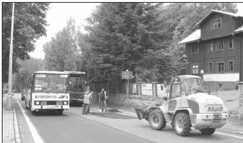
Začátkem července měli silničáři na hlavní komunikaci pořádně napilno