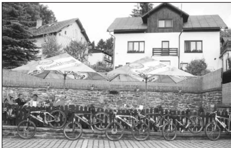
Cyklistický plot před restaurací U císaře Rudolfa II