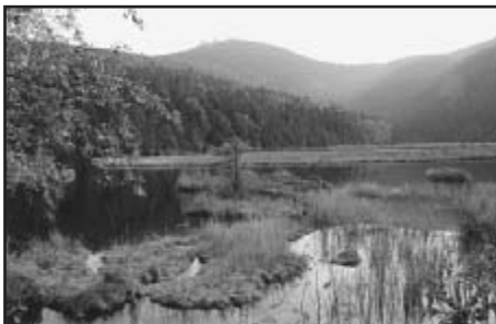
Malé javorské jezero, které můžete snadno celé obejít a kochat se pohledem na Velký Javor

Otázka „Už tam budeme?“ patří k těm, které často při společných cestách se svými dětmi slyšíme. Nedávno jsem ale při zdolávání kopce na Pancíř zaslechla z úst - náctileté slečny dotaz „Proč musíme jít nahoru, když za chvíli půjdeme zase dolů?“ a rodiče začali hovořit o krásném výhledu do kraje a o výborné zmrzlině, kterou se všichni po náročném výstupu osvěží. Nevím, zda měli s náplní tohoto výletu úspěch, ale je zřejmé, že pokud si chcete prázdninové cesty se svými dětmi opravdu užít, vyberte dobře trasu i cíl vaší cesty.