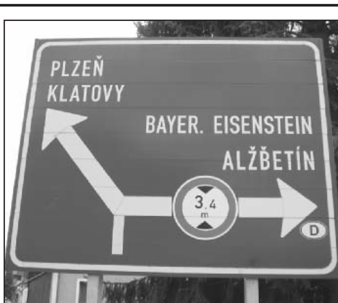
Chybíčka se vloudila – najdete ji?