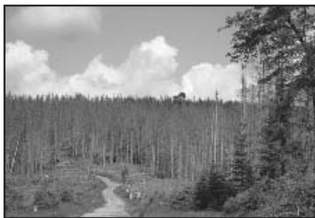
Poledník, předěl – pohled na suchý les jako výsledek zeleného experimentu se Šumavou

je možné odbočit k rozhledně. My se uhýbáme doleva na Bavorskou cestu (prašná) a po cca 2,5 km přijíždíme na křižovatku a najíždíme na asfaltku a po Vaňkově cestě sjíždíme do údolí, kde protéká Javoří potok na Javoří pilu. Při potoce projíždíme krásným údolím směrem Modrava. Během cesty se Javoří potok spojuje s Roklanským a do Modravy vtéká jako Roklanský. Nikde neodbočujeme a po přibližně 6 km