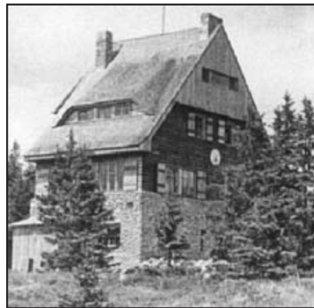
Takhle vypadala slavná Juránková chata v letech 1932 – 1945

Výše zmíněný hraniční pás vede až ke státní hranici, ale nedaleko před ní začíná Národní přírodní rezervace Černé a Čertovo jezero, takže tento úsek není možné projít, i když odtud dohlédneme na hranici a můžeme tu vidět po hraničním chodníku chodit turisty z Bavorska. Hřebenové partie totiž patří k nejcitlivějším ekosystémům Šumavy. Vrátit se můžeme tak, že na křižovatce ve tvaru T pokračujeme rovně další 3 km ke Statečku pod Ostrým a odtud do Hamrů. Smrkové lesy se střídají se smíšenými, hřeben je náhle zacloněn stinným pásmem lesů. Cesta, kdysi hrbolatá, je pěkně opravena od Lesů ČR a je sjízdná i pro kola. -rh-