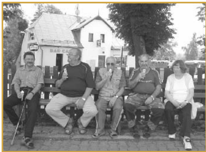
Letní zmrzlinová idylka železnorudských obyvatel naproti Pohádkové cukrárně

ZM schválilo celoroční hospodaření města, závěrečný účet za rok 2011 včetně zprávy o přezkumu hospodaření města za loňský rok s výhradou odstranění ve zprávě zmíněných nedostatků. ZM též schválilo Obecně závaznou vyhlášku č.17/2012 ustanovení koeficientů výpočtu ceny daně z nemovitostí.