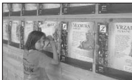
Malá návštěvnice u Pohádkové boudy

V zahradě pak můžete obdivovat tři desítky velmi rozmanitých pohádkových bytostí. Pro potěchu široké veřejnosti je za honorář propůj- čila právě Vítězslava Klimtová. Všichni skřítko- vé přebývají v malých dřevěných domečcích a pyšní se jak neobyčejným zjevem, tak rozto- divnými jmény. A tak tu sídlí například Zmola, Škvírník, Bludák, Pařezák či Houbábinka a mnozí další. Při průzkumu kouzelné zahrady se o nich můžete hodně dozvědět, zvláště pak o jejich vlastnostech a chování. Za zlatý hřeb se dá pokládat Drak. U nejmenších občas budi strach, ježto vypouští nozdrami dým. Zahradu obohacují staré dřevěné vozy a jiné předměty z dávných dob. Zpívají tu ptáci a protéká tudy stoprocentně pitná voda, jíž se lze v parních dnech bez obav osvěžit. Zahradní cestičku, stejně jako povrch níže zmíněného adrenalin- ového hřiště, pokrývá přírodní dřevěná štěpka. Její nespornou výhodou je kromě hygienické nezávadnosti i to, že při pádu na ni dětem ne- hrozí ušpinění nebo poranění.