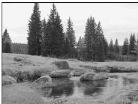
Malebná partie na Javořím potoce

Pomalu stoupáme po prašné cestě. Po stranách je patrná zkáza, kterou přinesla loňská letní bouře. Po dvou km míváme odbočku na Prášilské jezero a začíná strmější stoupaní, ve kterém se nám otevírá pohled na les napadený kůrovcem. Po pěti km přichází velmi prudké stoupaní, ale to už se blížíme k předělu pod Poledníkem. Zde