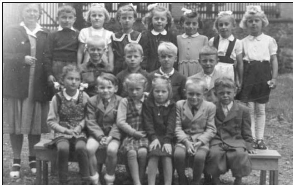
Výroční foto 1. třídy z roku 1949

Železnorudská třída ukončila svoji povinnou školní docházkou ve školním roce 1955/1956 absolvováním 8. třídy Osmileté střední školy v Že-