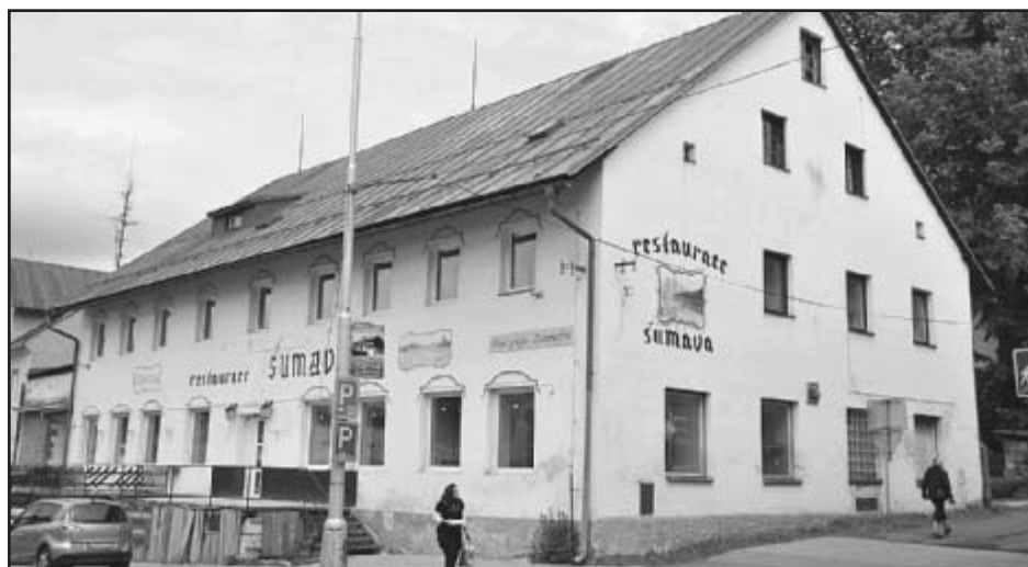
Budova bývalé restaurace Šumava čeká již delší dobu na nově a smysluplné využití

Fotogalerie již zrekonstruovaných interiérů je možné vidět na www.nudavrude.cz -rh-