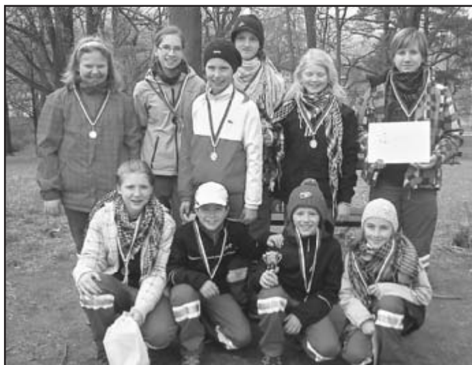
Obě úspěšné hlídky mladých zdravotníků