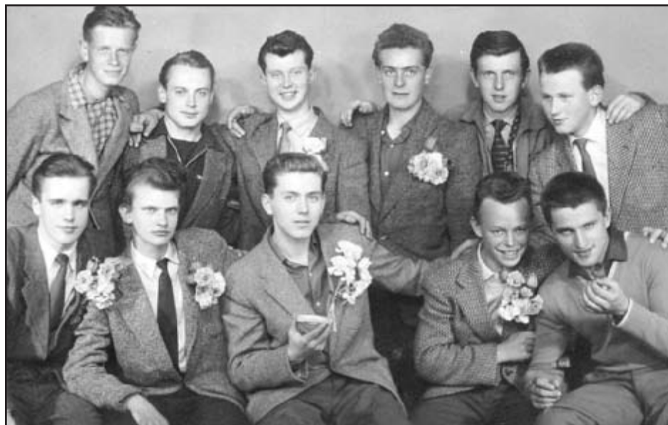
Osmnáctiletí železnorudští kluci při odvodu v roce 1960