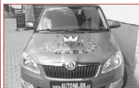
Výherní auto před Casinem 2. 6. 2012 v den oslavy 20 let od založení již má šťastnou majitelku z Německa. O průběhu oslav a o Casinu jako takovém budeme informovat v příštím čísle