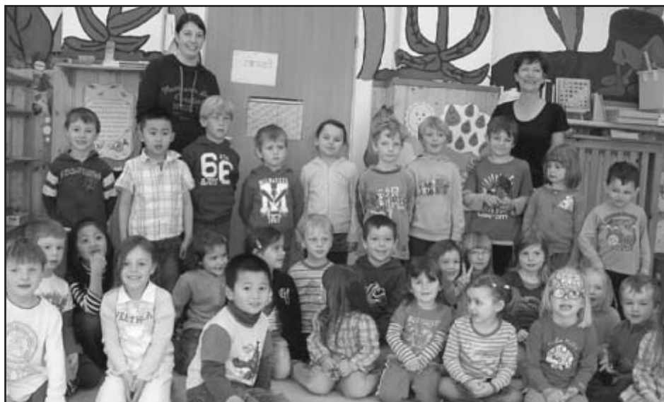
Na návštěvě MŠ v Bayerisch Eisenstein

V pátek 22. 6. 2012 od 16 hodin vás všechny zveme na zahradu MŠ! Zveme „BROUČKY“, „SLUNÍČKA“, „ČMELÁKY“ se svými rodiči na naši Zahradní slavnost, kdy odpoledne budeme soutěžit v různých disciplínách, mlsat, zpívat, opékat i buřtíky a čekají nás další překvapení... Uvitáme vás v maskách pohádkových bytostí – děti i rodiče. Naši předškoláci se rozloučí s MŠ a prožijeme s nimi „slavnostní výkop“ z MŠ. Chceme vesele zakončit školní rok 2011/2012. Přijďte se pobavit se svými dětmi před letními prázdninami do mateřské školy!