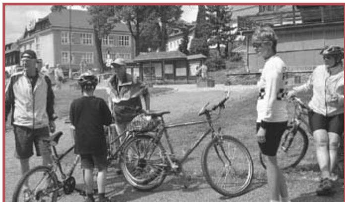
Slunečné počasí přivítalo první návštěvníky Železné Rudy