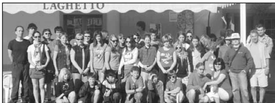
V tomto hotelu jsme již tradičně byli ubytováni