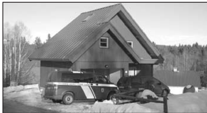
Nová záchranná stanice horské služby v Prášilech

Uteklo dlouhých 64 let a současná Horská služba Šumava zajišťuje záchrannou činnost od hory Ostrý až po Lipno. Za tuto dlouhou dobu bylo mnoho vytvořeno a vybudováno od kvalitního zázemí pro záchranáře až uložení záchranného materiálu a techniky. Byly postaveny moderní domy horské služby, stanice s ošetřovnicemi, služebny, garáže pro nejlepší techniku, kterou obsluhují kvalitně vyškolení a vycvičení profesionálové. Horská služba je dnes moderní záchrannou organizací, která je napojena na Integrovaný záchranný systém, Zdravotnickou záchrannou službu, Leteckou záchrannou službu, Policii ČR, Hasičský záchranný sbor a ostatní složky IZS.