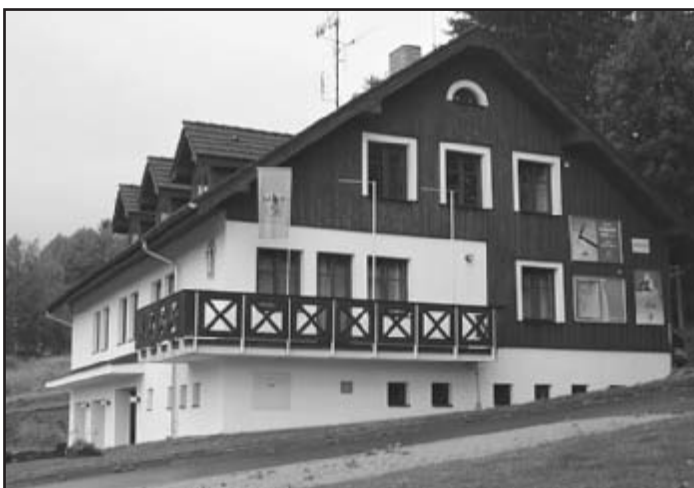
Ústředí Horské služby Šumava na Špičáku