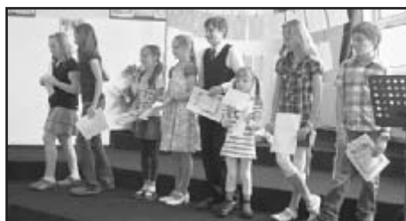
Vyhlášení výsledků v kategorii Komorní hra