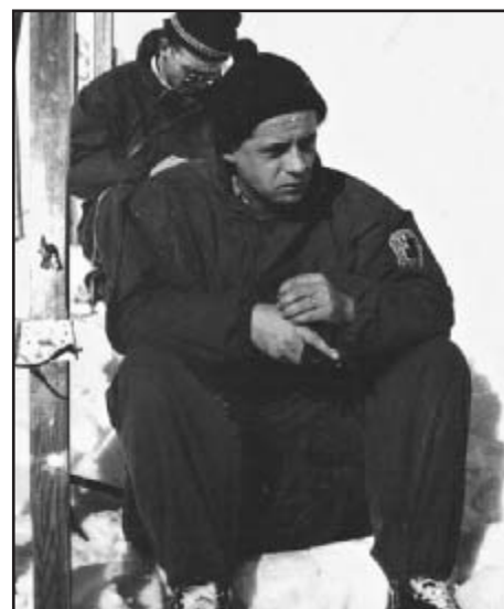
Skromné vybavení tehdejších záchranářů Horské služby

dřevěné lodičky od armády a sanitní brašna pro první pomoc od Červeného kříže tvořily veškeré záchranné vybavení. V pozdějších letech, kdy byla horská služba začleněna pod ČSTV, dostala kvalitnější zdravotní vybavení od Ústavu národního zdraví (dřevěné dlahy, Kramerovy dlahy, nafukovací dlahy, extenzní dlahy a americké dlahy). V roce 1975 přišly na Šumavu již velice kvalitní rakouské saně Akie a skútr Snowtrick určený pro svoz zraněných ze vzdáleného terénu. První stanice horské služby na Špičáku byla na Weissově louce. Vypadala jako trafik a HZS ji dostala jako dar od vojenské zotavovny Rixi. V roce 1961 se postavila na Weissově louce na tehdejší dobu moderní dřevěná chata, která tam stojí dodnes, ale již má jiného majitele.