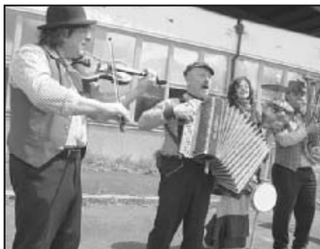
Od Plzně dorazil legendární Švejč-band

Nejrůznější setkání českých a německých obyvatel z příhraničí se stalo již tradicí. Letošní česko-bavorská neděle v prostoru bývalé české celnice nebyla výjimkou. Naopak se svým datem 13. května ukázala být velmi vhodnou volbou a určitě přispěla k pravidelnému utužování vztahů sousedních zemí. I když si v ten den