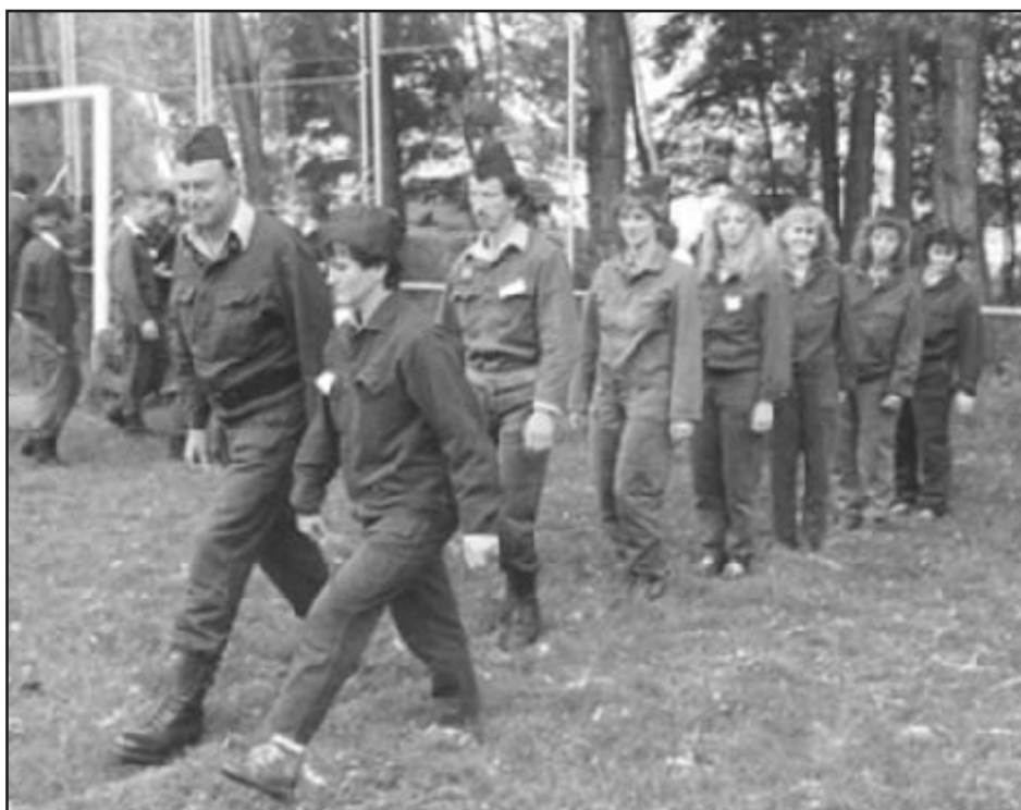
Na hasičské soutěži v Milencích spolu s družstvem mužů