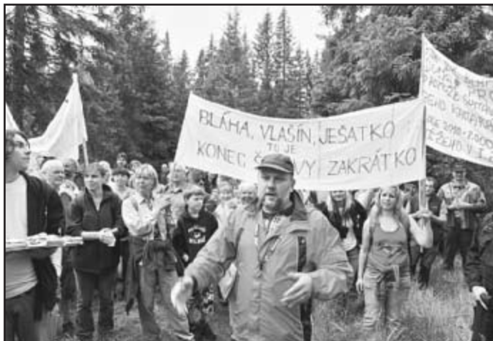
Protesty na Šumavě nekončí, když se proti zeleným aktivistům vydají do boje obce