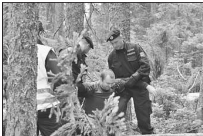
Placení ekoaktivistů blokuje kácení stromů napadených kůrovcem