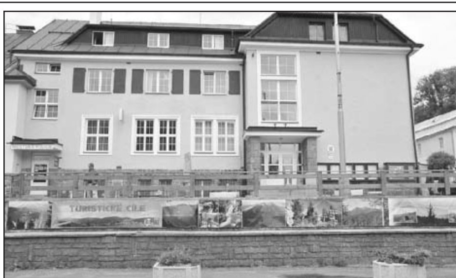
Nové barevné billboardy před radnicí, kde je i nové Informační a turistické centrum, informují návštěvníky města o turistických cílech na Železnorudsku