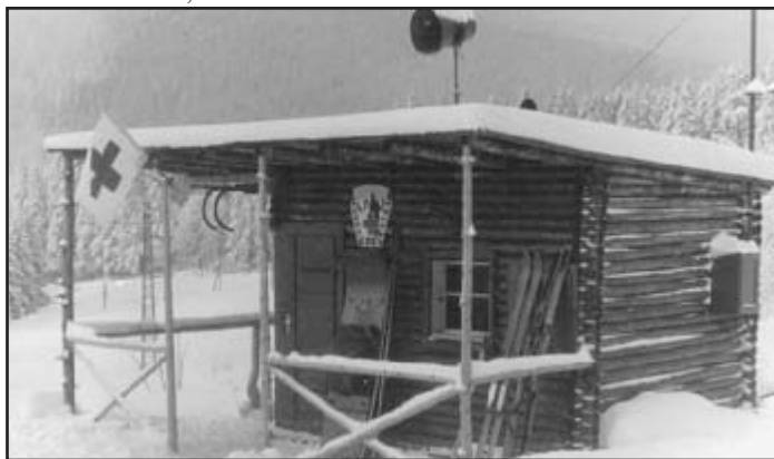
První stanice Horské služby na Weissově louce