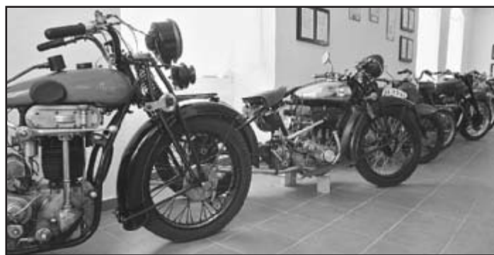
Pohled na část expozice starých motocyklů