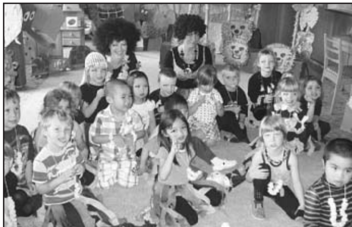
Přidržte si čepice! Hop – a už jsme v Africe!