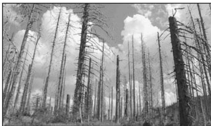
Takový les je prý hezčí, míní ekoaktivisté z Hnutí Duha

Václav Janouš, – Mladá fronta Dnes – jižní Čechy Uveřejněno se souhlasem redakce MF Dnes