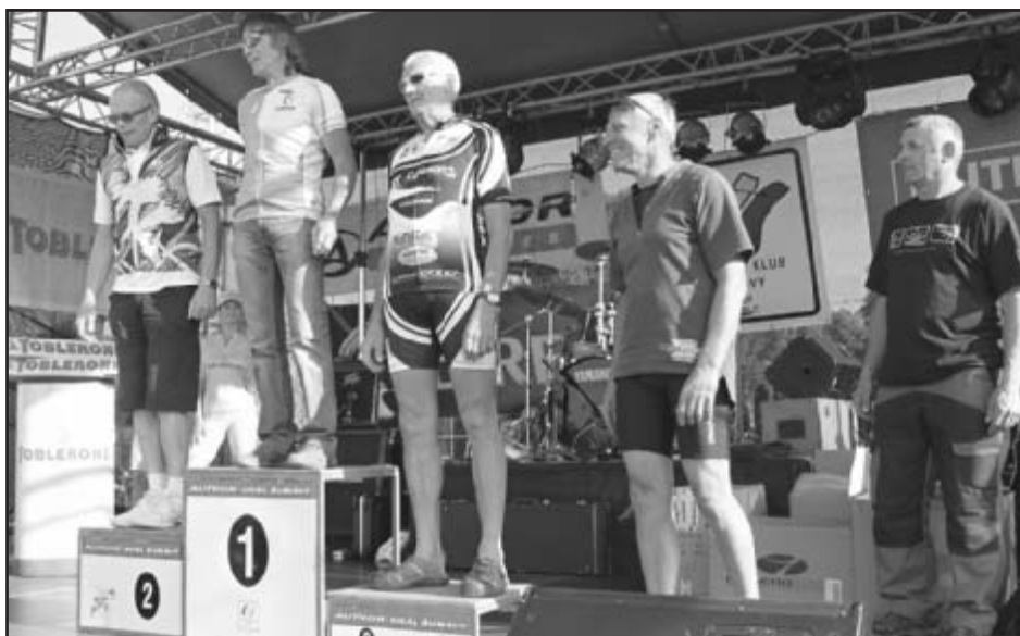
Na pódiu mezi Králi Šumavy

Vydáte se cyklostezkou ze Železné Rudy do Bavorské Rudy, kde se u benzínové pumpy pod kostelem dáte vlevo pod železniční trať. Pokračujete podél trati přes silnici do Domu divočiny. Po nevědní prohlídce divokých zvířat v oplocených výběžích to vezmete zpátky přes silnici na Zwieslerwaldhaus směrem na Schwellhäusl s výletní restaurací. Za ním potom směřujete vpravo do kopce a před potokem na Ferdinandovo údolí a Debrník do Železné Rudy, odkud jste vyjeli.