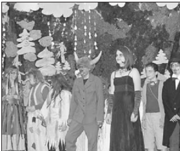
Mladí herci po představení zdraví diváky