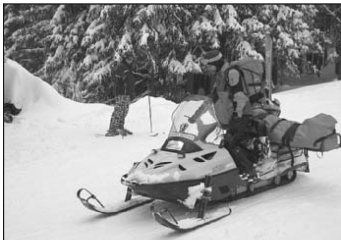
Transport zraněného pomocí moderní techniky