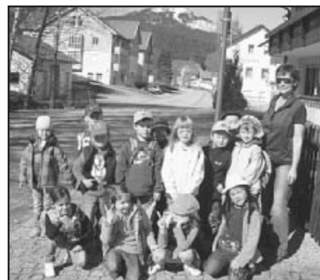
Čmeláci v Německu