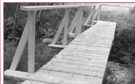
Nejen starší spoluobčané vítají opravu někdejší lávky přes říčku Řeznou u fotbalového hřiště