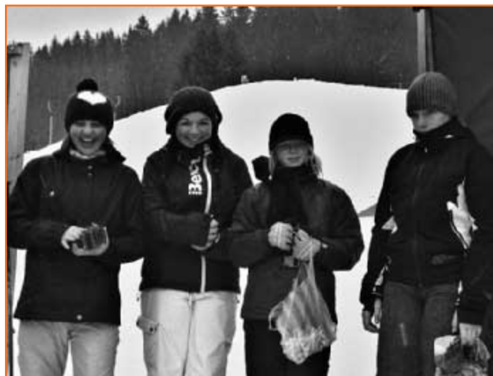
Na organizaci olympiády se podíleli žáci 2. stupně