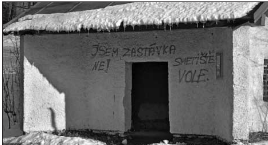
I tato zastávka bude zrušena...?

Informace z MěÚ zpracovala Lucie Charlotte Kopecká