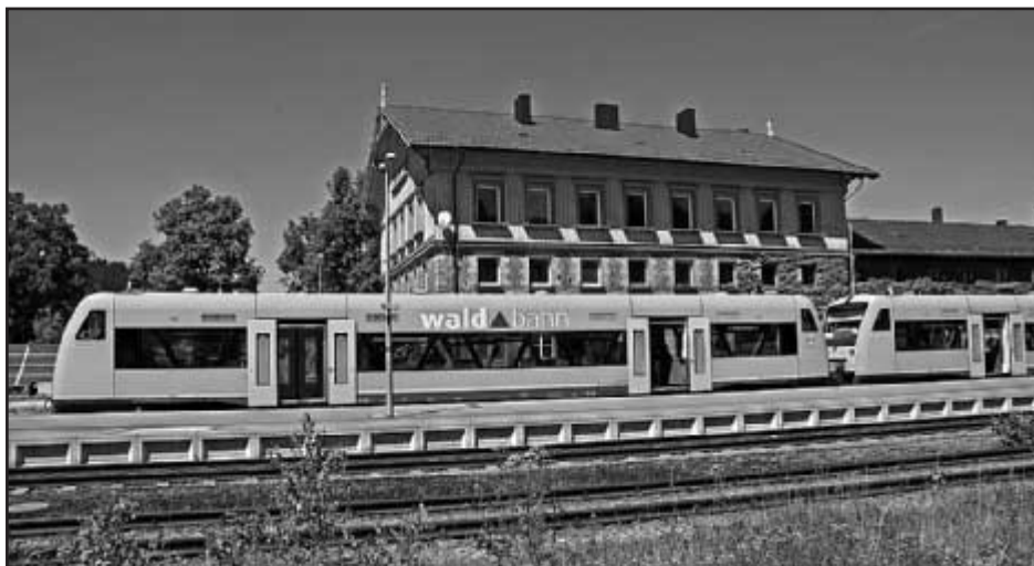
Waldbahn končí s provozem

Cestování Waldbahnem z Česka do Německa bylo výhodné hlavně pro cyklisty. Vítili ho i turisté, kteří v hodinu vzdáleném Plattlingu přestupovali na vlaky ICE ve vysokorychlostním koridoru směrem na Frankfurt nebo v režimu regionálního expresu na Mnichov. Na odborném webu ŽelPage se hovořilo o možnosti prodloužení Waldbahn až do Klatov, což mnozí diskutěři vítali. Zde jeden z hlasů: „A s tím zajížděním do Klatov... Je pravda, že v Železné Rudě je stále železná opona patrná. Od Plattlingu do Bavorské Rudy tiše přijede souprava RegioShuttllü, zastaví u peronu a cestující pohodlně vystoupí z nízkopodlažních vozů. Na vedlejší koleji fira natočí motor brejlovce, ten vychrlí oblaka tmavého dýmu, cestující se začnou věšet na kliky zlamovacích dveří a šplhat po schodech nahoru, s velkým rachotem vlečou lyže skrz tvrdohlavě se zavírající přechodové můstky, snaží se zavřít okna zkrřížená v rámech, průvodčí práskají dveřmi a souprava se s velkým skřípěním houpe přes výhybky na svou předlouhou cestu do daleké Plzně.“ -red-