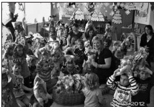
Travel FREE v MŠ