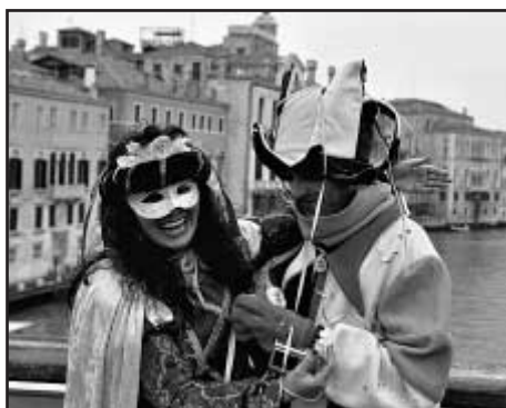
Na Ponte Academica je vždy veselo