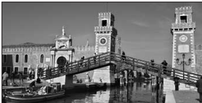
Benátská skvostná středověká architektura a kanály