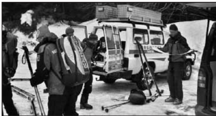
Příprava skialpinistického vybavení

nového nebezpečí na našich horách. V Krkonoších byl dokonce vyhlášen lavinový stupeň číslo 4. a sesuv lavin hrozil i v takzvaných nelavinových oblastech našich hor. V Beskydech, které jsou charakterizovány jako nelavinová oblast byl zaznamenán sesuv laviny, která zasypala lyžaře. I na Šumavě, během letošní zimní sezóny, kdy docházelo k pravidelnému mě-