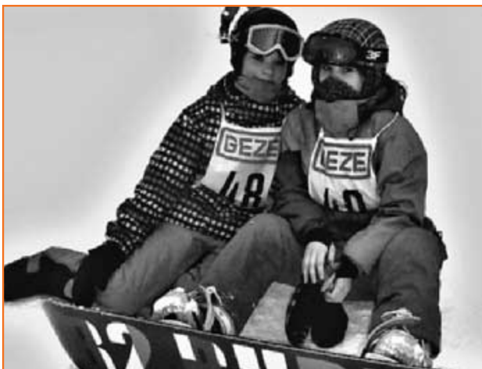
Dvě úspěšné reprezentantky naší školy po závodu