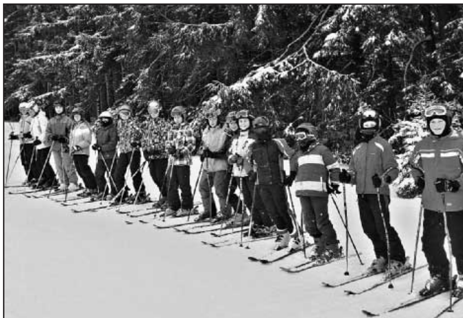
Ohlédnutí za školním lyžařským výcvikem žáků 6. třídy