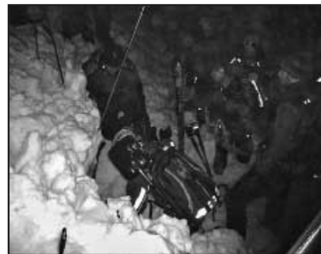
Nález a vykopání postiženého lyžaře

Právě záchrana osob z nepřístupného terénu, byla námětem společného cvičení Horské služby Šumava a německého Bergwachtu, které se konalo