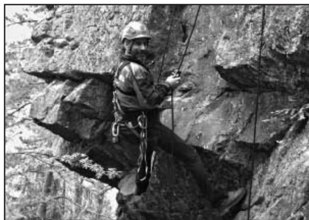
Lezecký výcvik je součástí doškolení Horské služby (2011)