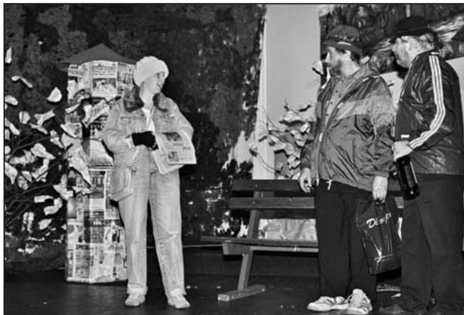
Divadlo v Železné Rudě