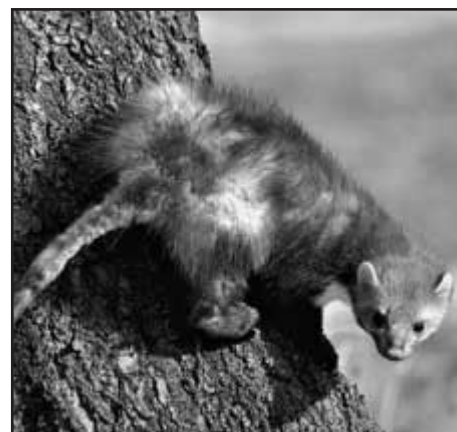
I tato kuna lesní se nechala vylákat prvními jarními dny a užívá si sluníčka.