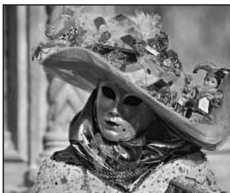
Tradiční karnevalové masky všude kam pohlédnete