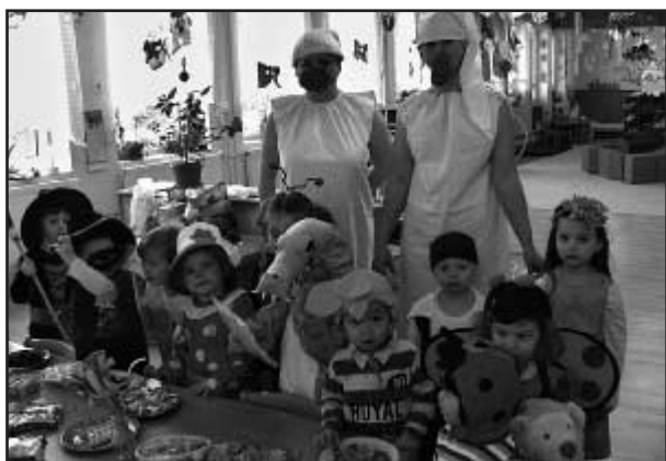
Maškarní u Broučků

Únor byl pro děti z Železné Rudy krásným zimním měsícem plným sněhu na zahradě, který všechny lákal ke hrám se sněhem, klouzání i koulování. Proto se také uskutečnily veselé sportovní HRY NA SNĚHU pro všechny děti z MŠ. Plnily jsme různé úkoly, které byly rozmístěné po celé zahradě - házení koule na cíl, prolézání obručí, závody na klouzácích, přetahovaná a na závěr hledání pokladu. Každé dítě bylo oceněno medailí, kterou si odneslo domů. Krásné aktivní dopoledne je vidět na fotografiích.