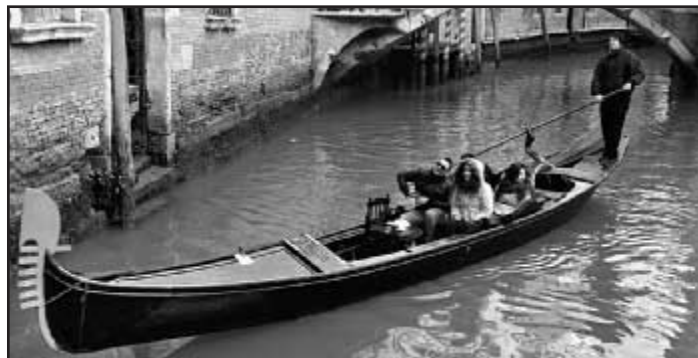
V době karnevalu se benátská gondoliéři nezastaví