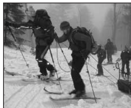
Transport materiálu a záchranných prostředků na laviniště

jsou nutné pro zvládnutí této akce. Přesun záchranářů a záchranného materiálu proběhl pomocí terénních vozidel, terénních čtyřkolek a sněžných skútrů. Na místo lavinové nehody, které se nacházelo ve velice exponovaném terénu bylo možno dopravit záchranný materiál již jen pomocí lidské síly a skialpinistického vybavení. Průběh celé akce, od nahlášení události až po předání zraněných posádce Zdravotnické záchranné služby,