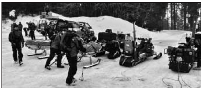
Cvičná lavinová akce - příprava techniky k transportu záchranářů

letošní zimní sezóna byla opravdu bohatá na sněhovou nadílku, kdy sněhová pokrývka na hřebenových partiích českých hor dosahovala výšky přes dva metry. Velké množství napadaného čerstvého sněhu, které zasypalo naše hory ve velice krátké době, vedlo k vyhlášení zvýšeného lavi-