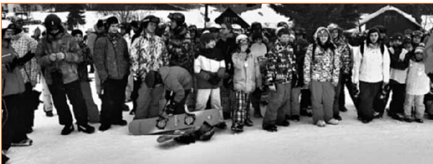
Sportovní areál Nad Nádražím zaplnili žáci a studenti z Klatovska