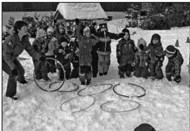
Hry na sněhu v MŠ