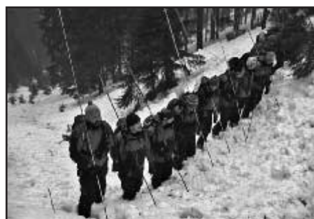
Sondovací družstvo v akci

ření sněhu a monitorování exponovaných svahů, byl zaznamenán sesuv sněhu s délkou lavinové dráhy delší než sto metrů. Kvalitní sněhové podmínky přilákají vždy velké množství lyžařů nejen na sjezdové a běžecké tratě, ale stále častěji se lyžaři a snowboardisté vydávají lyžovat do volného terénu. Tito lyžaři bohužel nerespektují hrozící nebezpečí v podobě možnosti pádu lavin, o kterém pravidelně informuje horská služba, a nerespektují ani zákazy