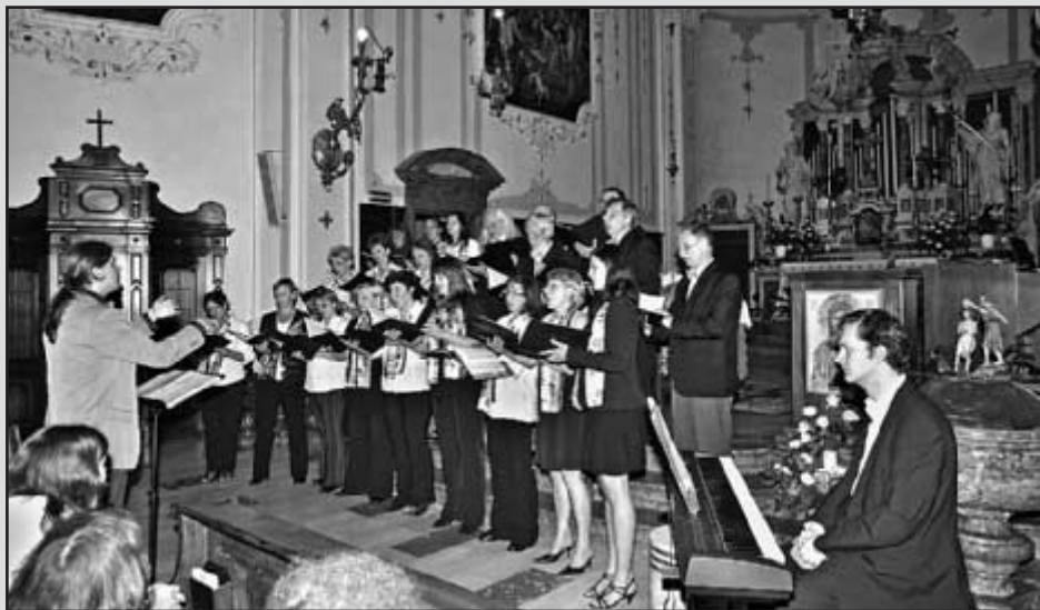
Velkým potleskem a ovacemi bylo odměněno vystoupení souboru v partnerském městě Aldeno - 2011 v Itálii