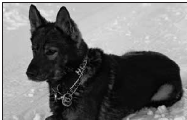
Záchranářský pes Bad (z lavinového cvičení Rakousko 2011)

To je pravda, ale říci o bagristovi, že může za to, že přerchl kabel, pokud nebyl řádně vyznačen, je absolutní nesmysl, pod zem nikdo nevidí. Objednavatel práce je povinen zajistit vytýčení sítí a já pracuji v prostorách, kde je objednavatelem garantováno, že se žádné kabely nenachází. Samozřejmě, že k přerušení kabeláže při naší práci došlo. V naší oblasti to jsou například staré vojenské kabely, o kterých dnes nikdo ani neví a ani neexistuje žádná jejich evidence. K nehodě došlo i v případě, že zadavatel neprovedl správně vytýčení a se slovy: Tady kopejte, tady nic není! nás poslal někam, kde bohužel opravdu něco bylo. Vytýčení totiž stojí čas a peníze. Předpisy ale na toto pamatují, jsou jednoduché a fungují. Pokud strojník dostane dobré zadání své práce, k podobným nehodám nedochází. Lépe se samozřejmě pracuje v místech nových inženýrských sítí, kde je dokumentace na centimetry přesná a veškeré uložení odpovídá platným předpisům.