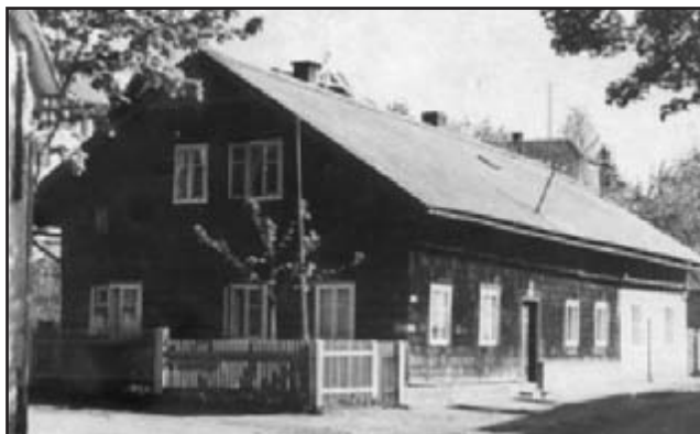
Jedno z prvních pracovních působišť Václava Svítíla, dnes restaurace U císaře Rudolfa II.

Přesto se i do srdce a duše Václava Svítíla vkradlo pár černočerných stínů, jež ho provázejí na životní pouti. Dcera Vlastička v mladém