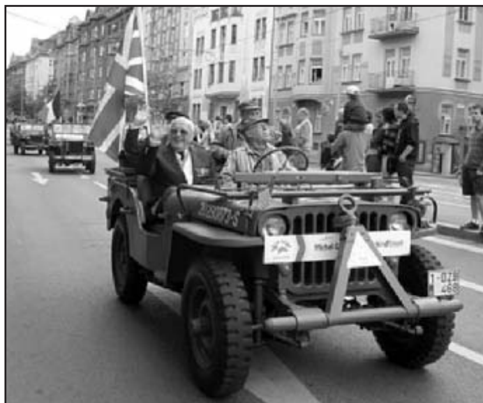
Convoy of Liberty projíždí Plzní