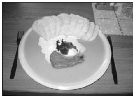
Je libo svičkovou?