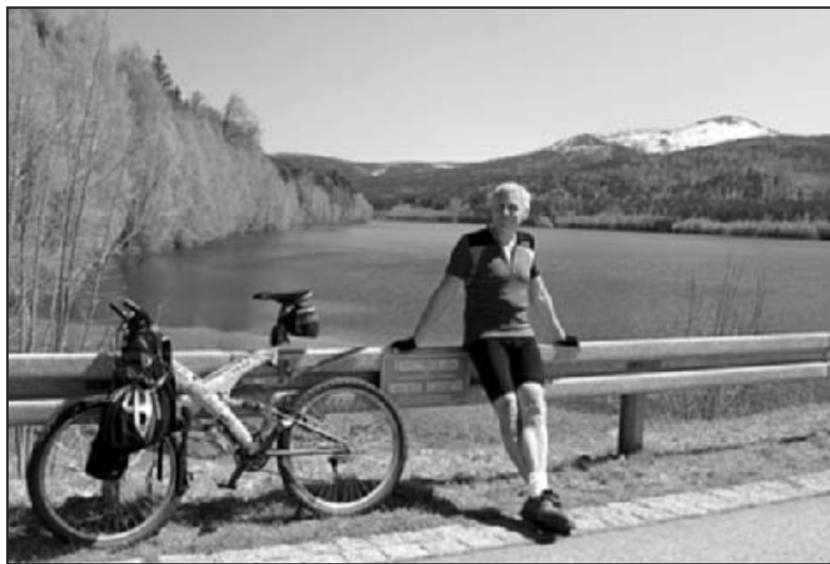
Na vodní přehradě u Frauenau v Bavorsku