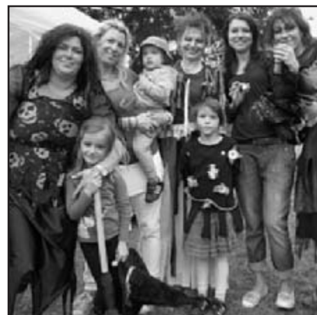
Slet „velkých čarodějnic“ na zahradě penzionu Habr