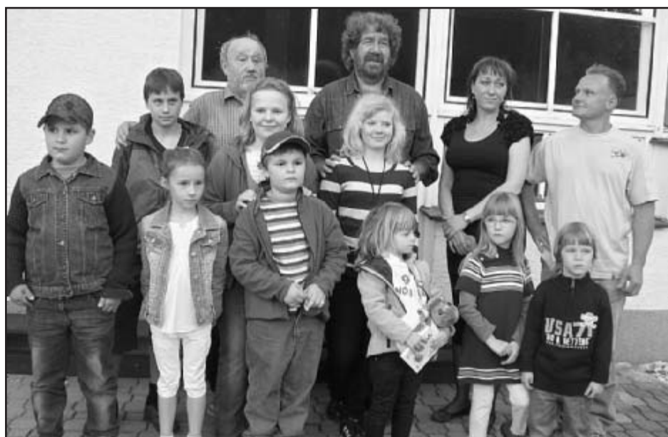
Setkání dětského ochotnického souboru s režisérem Zdeňkem Troškou 9. 5. před uvedením hry Amnestie