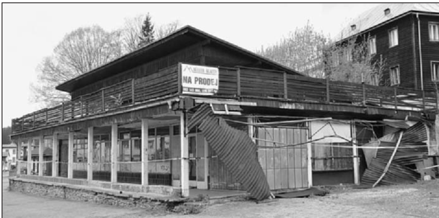
Jak ještě dlouho bude tato stavba hyzdít vzhled města?