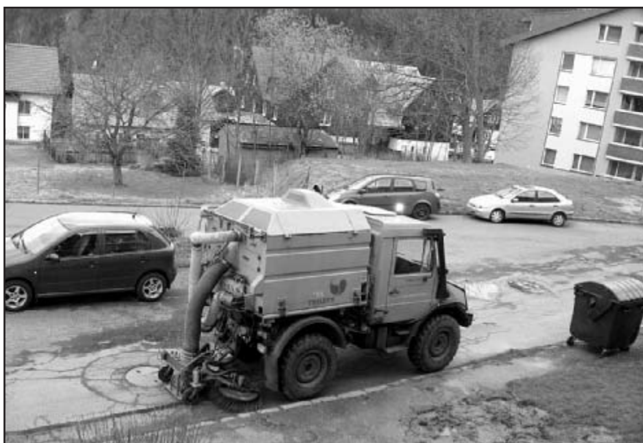
Úklidový vůz vytrvale brázdí ulice našeho města