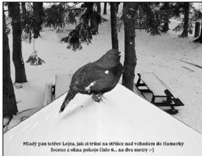
Mladý pan tetřev Lojza, jak si trůní na stříšce nad vchodem do Hamerky foceno z okna pokoje číslo 6... na dva metry :-)

Tetřev Lojzík. Tetřeva na Šumavě není třeba tolik chránit, není malé dítě, postará se sám. Na Šumavě je třeba chránit lidi, to je ohrožený druh.