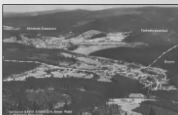
Pohled na Železnou Rudu a Bayerns Eisenstein, které rozhodla železná opona na čtyři desátky let.

VYSVĚTLIVKY / ERLÄUTERUNGEN: ● Místo, kde se nacházíte / Stelle, wo Sie sich befinden Trasa Belveder / Strecke Belveder Trasa Debrník / Strecke Debrník Informační místo NS Utajená obrana železné opony / Informationsstelle des NS (Utajená obrana železné opony) Administrativní desí čarobud / Grenze, Verwaltung des Grenzbezirgs Východní bod naučné stezky Utajená obrana železné opony / Ausgangspunkt des NS (Utajená obrana železné opony) ----- Signální pásma / Grenzmarken ☐ Označení stezky / Streckenbezeichnung Více informací o problematice poválečného opevnění najdete: Dobruška 4, Látková 3, Hrádky 2; Utajená obrana železné opony – Čs. opevnění 1945-1964, Praha 2008; Internetová aplikace na stránkách: www.rochlas.cz/bunsky