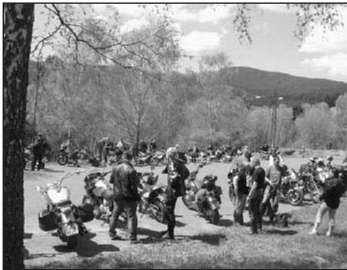
Zahájení letní motorkářské sezony na Kaskádách na Špičáku

Tolik stovek nadšených motorkářů z celého Plzeňského kraje a exkluzivních motorek, blyštících se v paprscích slunce, snad Železnorudsko pohromadě ještě nikdy předtím nezažilo! Na první pohled drsní chlápíci a sem tam i ženy v typických overalech se zlatými řetězy na krku zvolili špičácké Kaskády jako zakončení svojí prvomájové vyjížďky na vymazlených pekelných strojích, aby tak na horách neoficiálně oslavili zahájení letní sezóny.