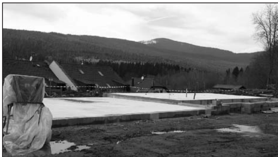
Základová betonová deska novostavby je již hotová

Dle podkladů tiskového mluvčího SŽDC Pavla Hally zpracovala LCK