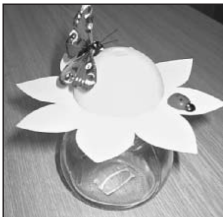
Dárek, který jistě potěší každou maminku

Příspěvek za jednu hodinu ve výši 20,- Kč je používán na nákup výtvarných pomůcek, které obstarává Šárka Štádlerová v prodejně Orvest v Plzni. Právě pro potřeby škol je zde možný