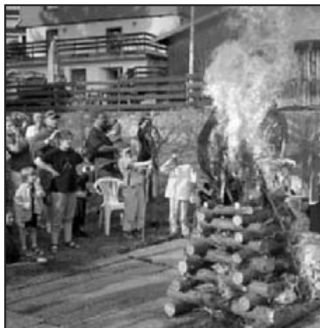
Všichni se zájmem přihlížejí pálení staré čarodějnice a těší se na vuřty

Soutěžít se bude v kategorii : sopránové zobcové flétny, dueta fléten klavír