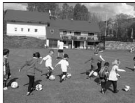
4. 5. zahájili nejmladší fotbalisté svou přípravu na hřišti prvním tréninkem