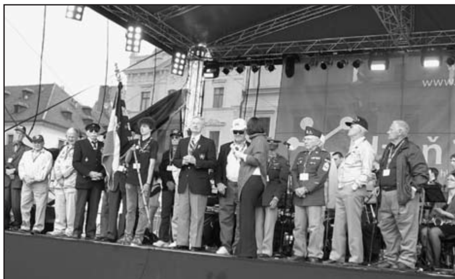
Váleční veteráni při slavnostním uvítání na plzeňském náměstí

Všem jubilantům blahopřeje sociální komise