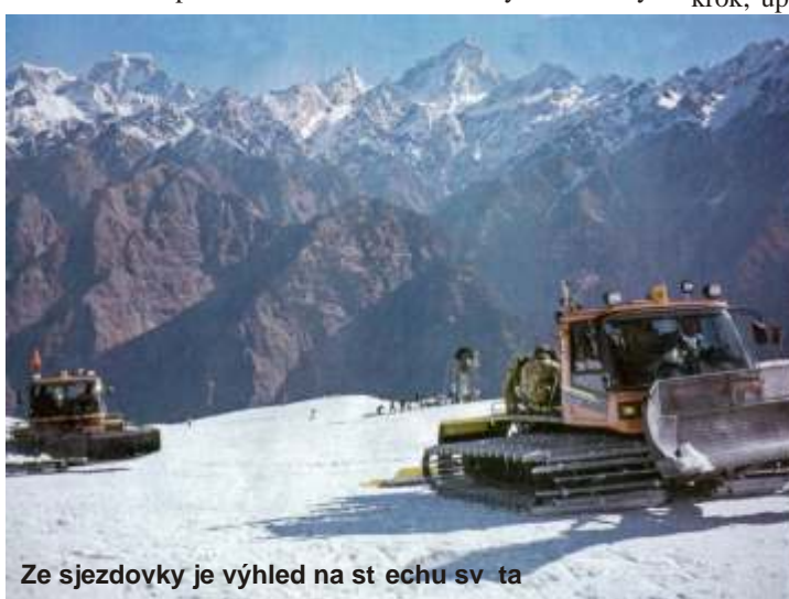
Ze sjezdovky je výhled na st echu sv ta

Situace se ani další dny nem nila. Po dvou dnech se nám kone n poda ilo navázat spojení s velvyslancem a seznámit ho se situací. B hem t chto dní se na letišti postupn shromáždilo na dva tisíce sn žných trose ník z celého sv ta. Mnohým