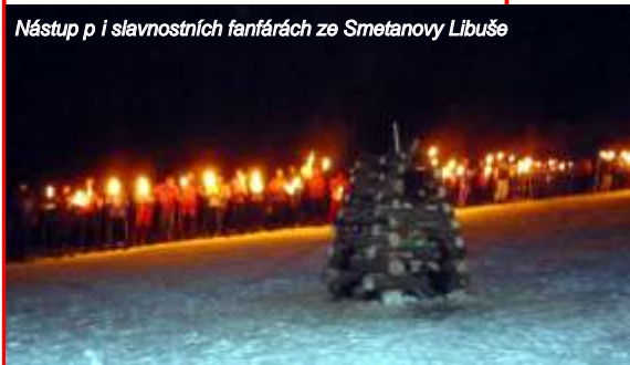
Nástup při slavnostních fanfárech ze Smetanovy Libuše

Na svahu se sešlo téměř tisíc diváků v dobrém náladě, zpívalo se, létaly lampióny šťastí, pro zahájení se pilo svačené víno a hladovým se nabízely klobásy. Všem pak podrobné informace z historie sjezdu (viz str. 5 - Horská služba). Mj. moderátor připomněl, že chata Blaženka ve sportovním areálu nemá jméno diváků, ale podle Blažeje Beneše, zakladatele areálu, že na Špiáku měli první osvětlený svah v republice už v roce 1980. Toho tehdy využili i reprezentanti ke svým tréninkům a připravili na olympiádu v Sarajevu. vedra