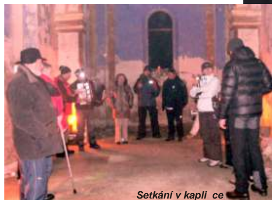
Setkání v kapli ce

kaple bude zn ov u obnovena, i kdy ž náklady na opravu budou vysoké.