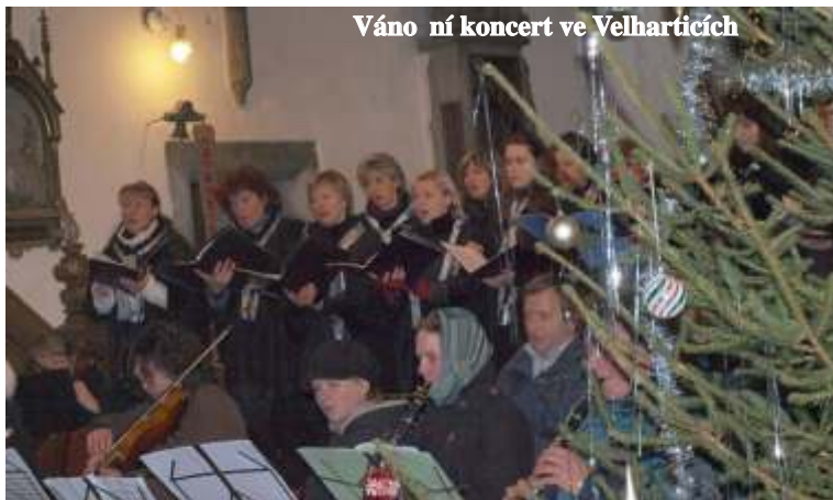
Váno ní koncert ve Velharticích

Železnorudský smíšený sbor se stále zlepšuje