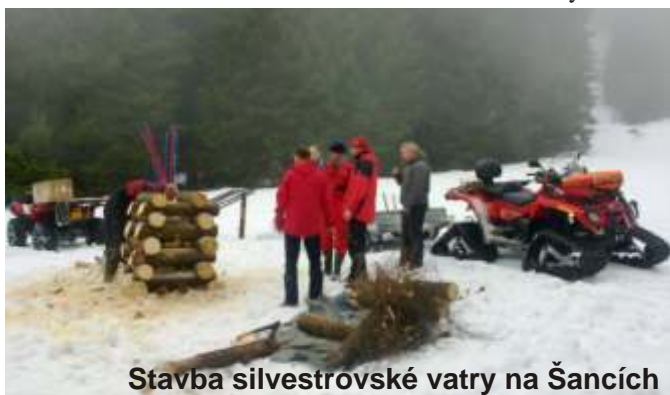
Stavba silvestrovské vatra na Šancích

Tímto p áním se rozlou ila Horská služba Šumava a šumavští lyža í na tradi ním sjezdu sjezdovky Šance s pochodn í na Špi áku 31. prosince 2010. Historie silvestrovského sjezdu sahá až do roku 1948, kdy byla na šumavském