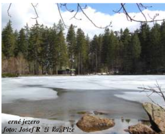
erné jezero

střelavého. Rozšíření rezervace bylo motivováno zejména zajištěním ochrany celých ledovcových karstů a jejich