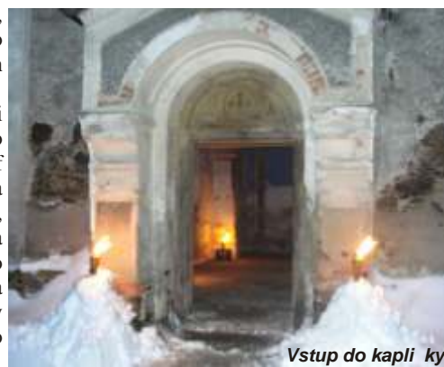
Vstup do kapli ky