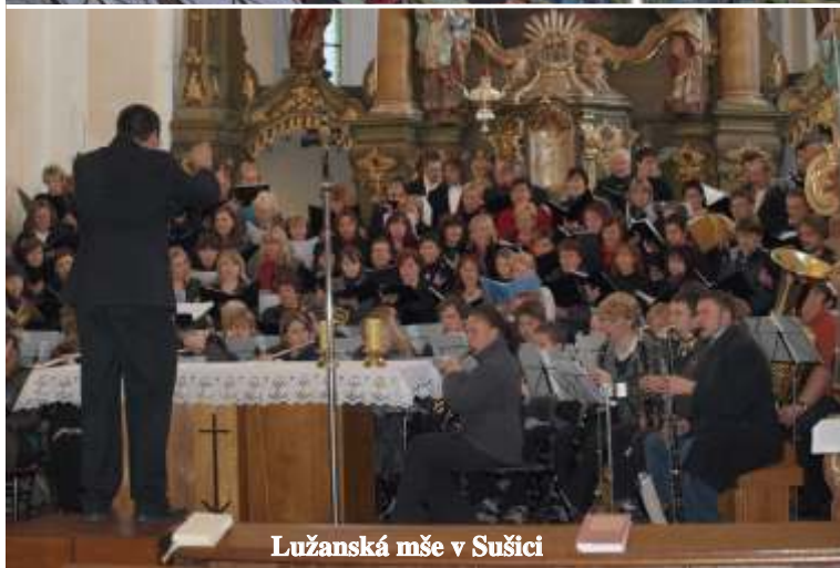
Lužanská mše v Sušici

lenové Železnorudského smíšeného sboru se naposledy vid li se svými p íznivci na tradi ních váno níh koncertech. P í té p íležitosti jsme m li možnost pod kovat za celoro ní p íze a také všem pop át do nového roku zdraví, št stí a spokojenost.