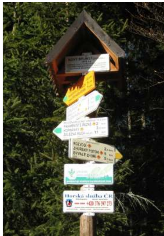
Vlevo dole: potisk informa ní tabulky Foto: rozcestník v terénu (Horská služba)