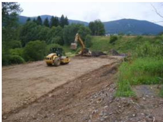
Práce na území

4.11.2008 byla ukončena třídenní výluka na železnici mezi stanicemi Špičák a Železná Ruda - msto. Byl tak v termínu obnoven provoz železnice po novém železobetonovém mostě, který je součástí stavby přeložky silnice II/190. Nová komunikace v délce 963 m bude dokončena v červnu 2009.