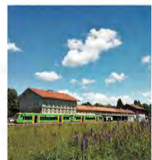
Foto: Budova muzea Naturpark Welten

Nádražní budova z roku 1877 je přesně ve svém středu rozdělena státní hranicí a v současné době slouží jako informační centrum Přírodního parku Bavorský les a Národního parku Šumava a Bavorský les. Součástí je také muzeum s interaktivními prvky Přírodního parku Bavorský les zaměřenými na tématu žitnat papýrů, Velký Javor, historie lyžování (s lyžařským simulátorem), stavba železnice a v nejvyšším patře je dokončen model železnice o ploše 260 m 2 . Součástí je také přednášková místnost, kinosál a historická restaurace.